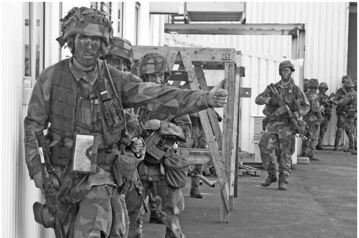
Som gammal Amf har man varit i Lysekil några gånger ...