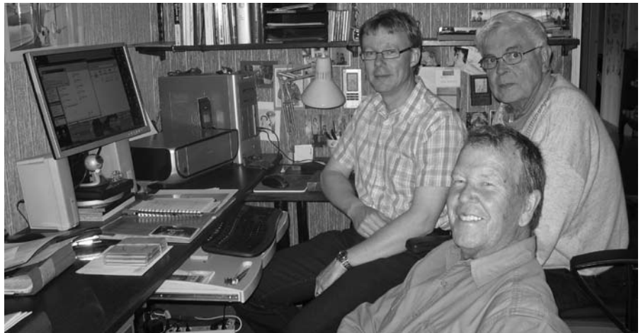
En nöjd fotogrupp som digitaliserat 11500 fotografier.

Cirka 11 500 fotografier omfattande tiden 1870-1998 har bevarats åt eftervärlden. Dessa förvaras för närvarande i kanslihusets källare och inryms i förvaringsboxar alternativt några fotopärmar. För att underlätta framtida "forskning" igångsattes genom Bengt Hörnbergs försorg ett arbete med att datorisera detta arkiv. Tyvärr hann inte vännen Bengt avsluta sitt arbete. Detta låg då i "träda" en längre tid.