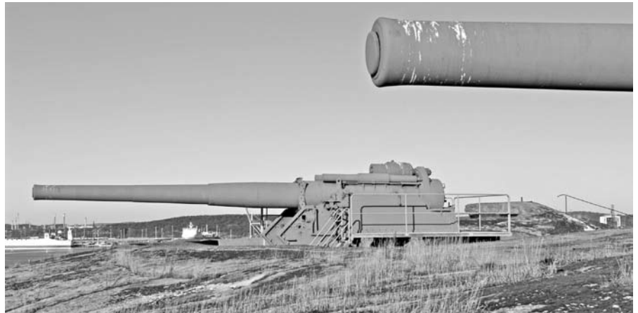
Två mäktiga 24 cm pjäser finns att beskåda på fortet.

Den 19 september gör vi en Kamratföreningsresa med buss till Kärningberget i Göteborg där vi blir guidade på det mäktiga Oskar den II fort. Det stod färdigt 1907 och invigdes av konung Oscar II och välsignades sedan av ärkebiskopen. Fortet med sina mäktiga pjäser har en spännande historia och är väl värt ett besök. I anslutning till fortet