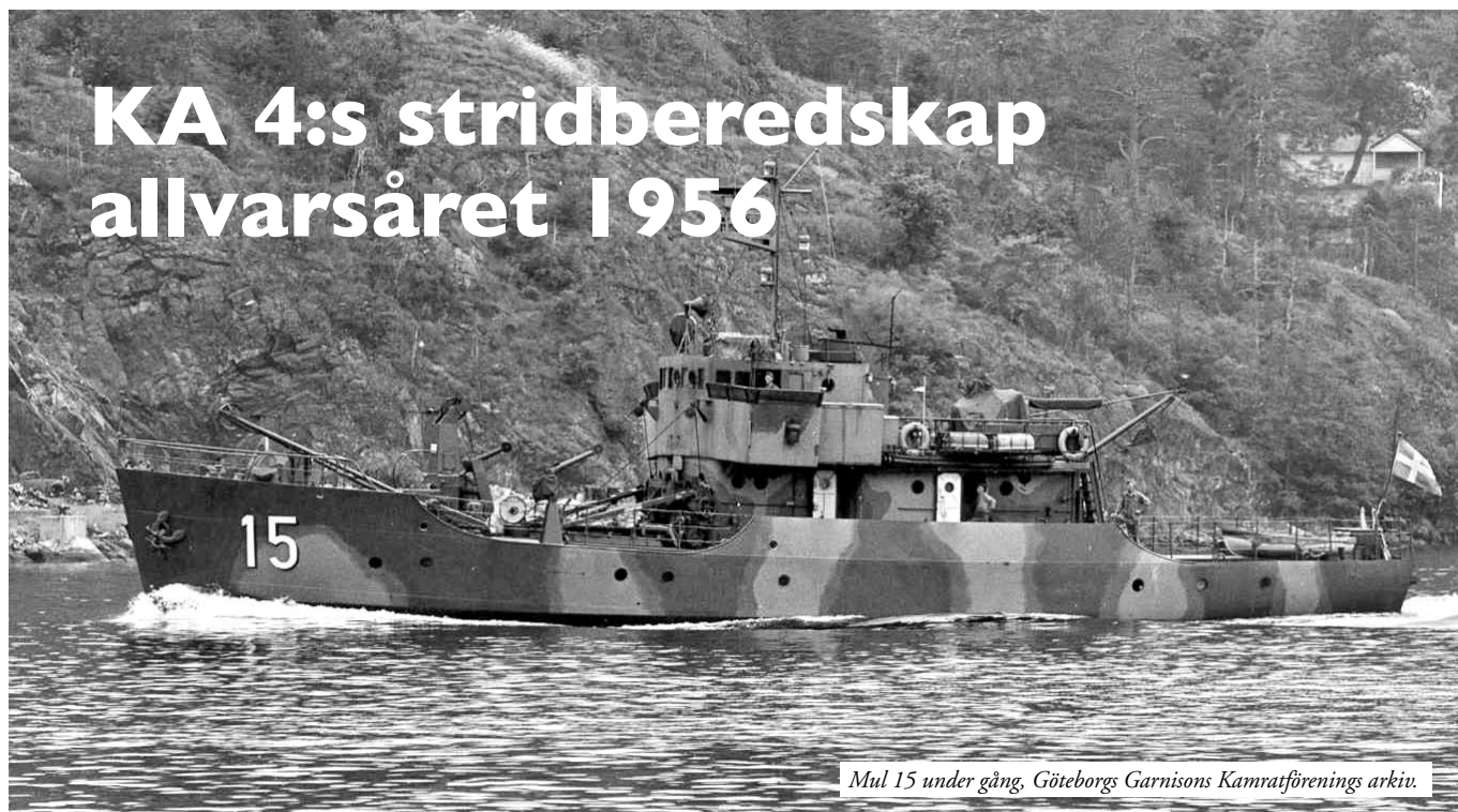
Mul 15 under gång, Göteborgs Garnisons Kamratförenings arkiv.