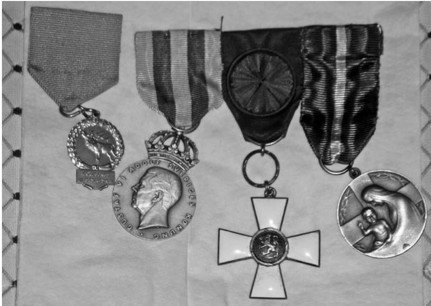
Några av Bo Risbergs medaljer och andra utmärkelser