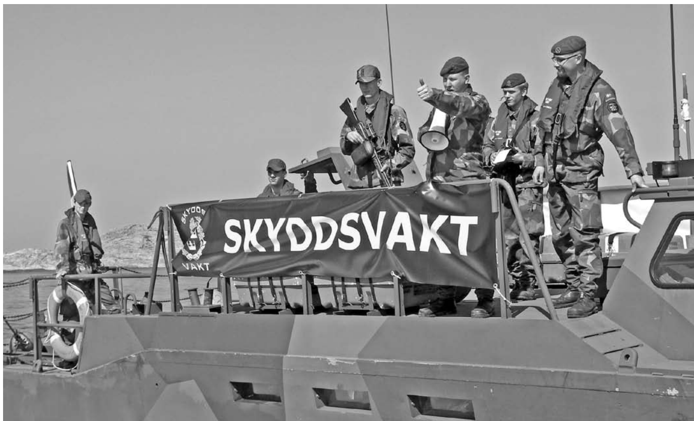
Stor inlevelse karaktäriserade bataljonens soldater