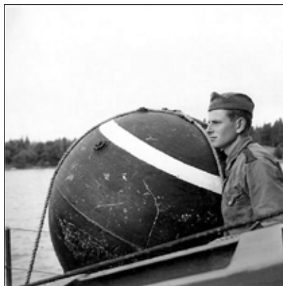
Skarpa minor gällde 1956