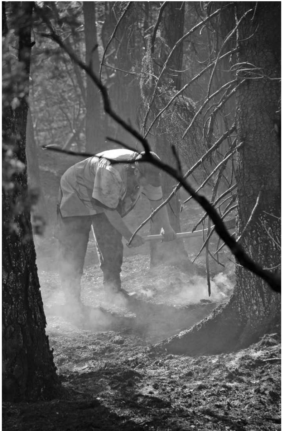
Arbetet i skogen var varmt – och rökigt. Det pynde överallt!

Soldaterna har släckt eld, bekämpat glödhärdar, burit mängder med slangar och patrullerat med motorcykel för att upptäcka nya bränder. Andra uppgifter var att med hjälp av terrängbilar transportera avlösningar och mat till släckningsstyrkan.