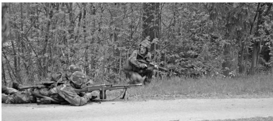
Ksp 58 in action med fokuserade hemvärnsmän