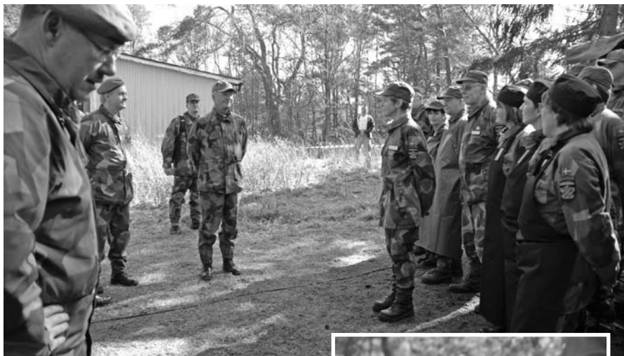
Förplägnadspersonalen fick kungligt beröm

En fältlunch stod sedan på programmet i ett gammalt hederligt "order- och mässtält". Lunchen tillagades av en förstärkt kokgrupp ur bataljonen och