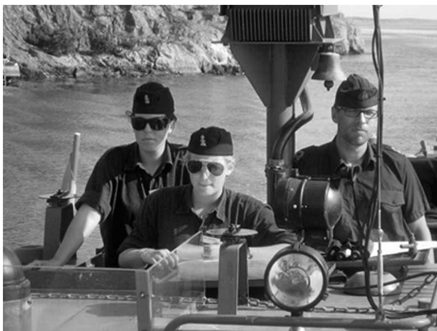
Utbildning på alla nivåer.