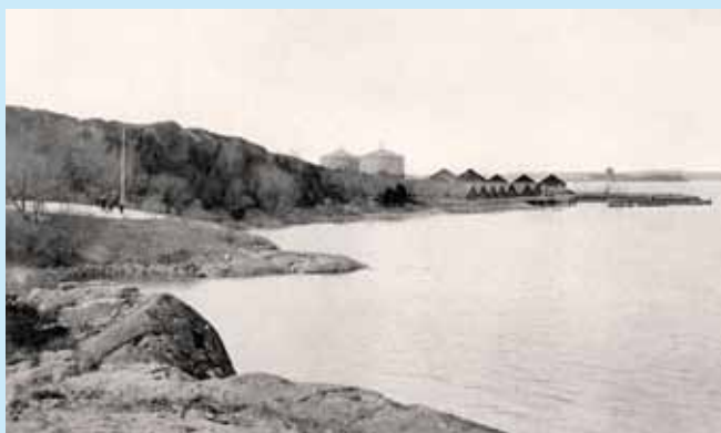
Älvnabben för 100 sedan. Obs SjuSkepp, strålkastarförrådet och cisternerna.