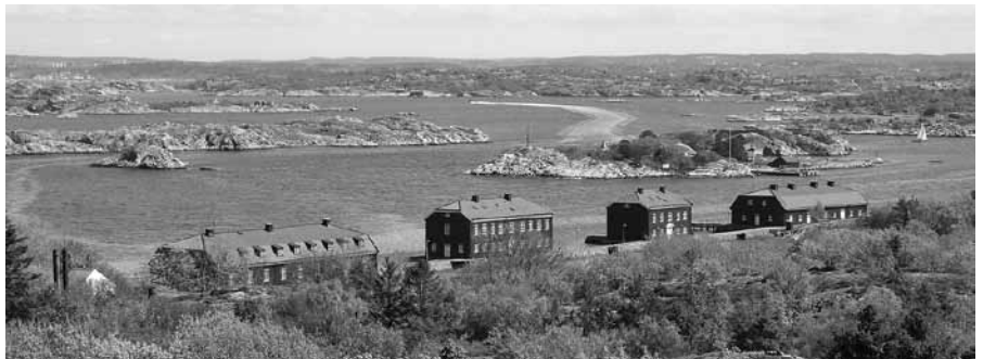
Käsös byggnader har haft många användningsätt genom tiderna