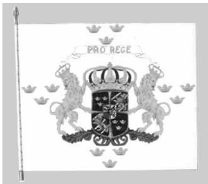
Sachsiska regementets livfana

1707 bröt förbandet upp och skeppades så småningom till Finland. Genom Karl XII:s marsch österut lättade trycket på Finland och de baltiska provinserna. Befälhavaren i Finland, generalmajoren Georg Lybecker, såg en möjlighet att uträtta något offensivt med sin drygt 10.000 man starka armé. Det mest närliggande målet för en svensk offensiv var S:t Petersburg, men då Lybecker saknade belägringsartilleri ansåg han sig inte kunna företa något mot staden. Han beslöt i stället för att marschera in i Ingermanland och vidare till Estland för att förena sig med de där stående svenska trupperna. I början av augusti 1708 var armén marschfärdig. Intensiva regnväder gjorde marschen svår och trupperna led också brist på proviant. En lyckad krigslist underlättade övergången av Neva och den 7 september stod hela finska armén i Ingermanland. Problemet för Lybecker var nu vart han skulle vända sig härnäst. 20 september hölls krigsråd,