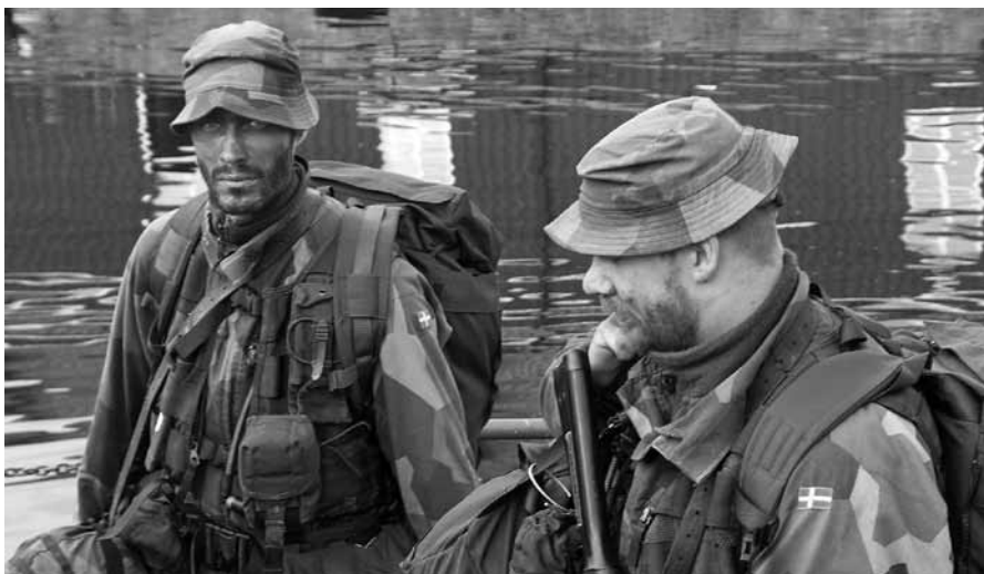
Hatten, kanske den mest kända symbolen för förbandet.