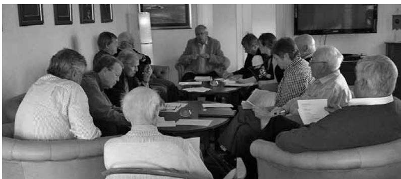
Manstarkt på Garnisonsmässen när FVM sammanträdde

Representanter för ett stort antal kamratföreningar, museer och militärkulturella föreningar samlades tisdagen 25 maj för att bilda Förbundet västsvenska militärrarvet. Förbundet är en vidareutveckling av den försvarsmuseala samrådsgrupp som funnits sedan slutet av 90-talet.