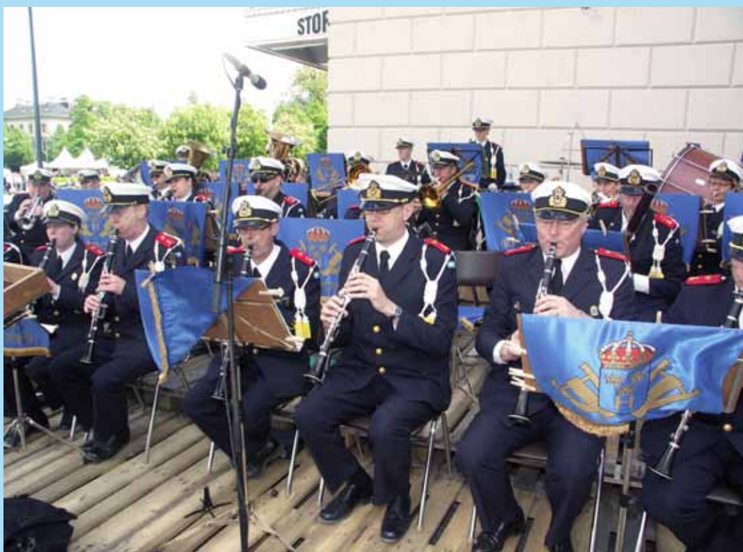
Hemvärnets Musikkår, Göteborg spelade utanför Stora Teatern