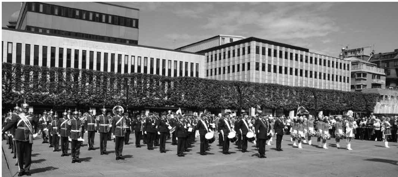
Militärmusikkåren uppställda på Stora Torget i Borås. Fler bilder på baksidan av tidningen!