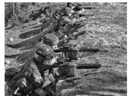
Det nyuppsatta Älvsborgs 2.a hv-insatskompani övar på Bråt

Övningens röda tråd var en teambuilding där de nya plutoncheferna och gruppcheferna skulle få en chans att lära känna sin personal. Extra viktigt eftersom många grupper var nya med personal från hela Älvsborgs bataljonsområde och upphämtade från fyra hemvärnskompanier. Det gav också kompaniledningen en möjlighet att följa de nya tillförda funktionerna och deras verksamhet.