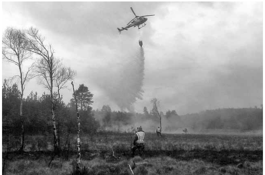
Släckningshelikoptern släpper sin värdefulla last

Det har nu gått ett drygt år efter att Elfsborgsgruppen tillsammans med många andra hemvärnsförband och värnpliktiga deltog i denna dramatiska och svåra skogsbrand. Allt har sammanfattats i en rapport av Ale kommun, som berömmar