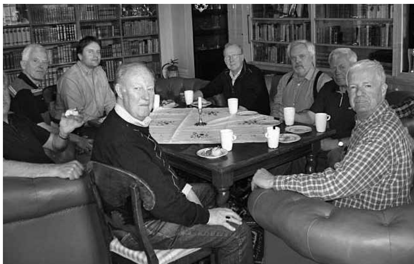
Lars Intresserade deltagare i studiecirkeln

Reportage om resan kommer i nästa nummer av vår tidning.