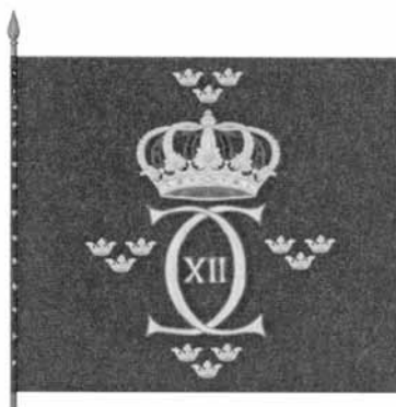
En kompanifana från 1700-talet.

som enhälligt fann att en marsch in i Estland var det enda alternativet. En sådan påbörjades också, men rätt snart kom Lybecker till övertygelsen att det bästa vore att avbryta hela företaget och återföra armén till Viborg med hjälp av flottan. Det misslyckade fälttåget fick sin upplösning vid Kolkanpää under perioden 9-17 oktober. Där togs större delen av armén lyckligt ombord på flottan och dess i all hast anskaffade handelsfartyg. Då ryska trupper anlände till platsen på förmiddagen 17 oktober var bara några hundra man ur två fristående sachsiska bataljoner kvar på stranden. Dessa blev raskt nedgjorda, särskilt som flottan saknade möjlighet att komma tillräckligt nära för att understödja med artillerield. På stranden låg också 6.000 döda hästar, en nog så allvarlig förlust för armén. De två sachsiska bataljonerna, Boijes och von Seulenburgs, förintades i princip vid Kolkanpää och de överlevande understöckts Schomers regemente.