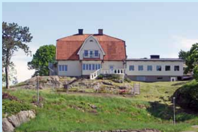
Dagens Älvsborgsmäss, f d bostad för oljedisponent

Brödernas tekniska kompetens gjorde att de kunde matcha giganter som Rockefeller och Standard Oil, som också var verksam i Baku. Det var främst vid distributionen som Nobelbröderna använde sin geniala kunskap och snart hade man ett nät av återförsäljare i hela Europa. Och här kommer Älvnabben in!