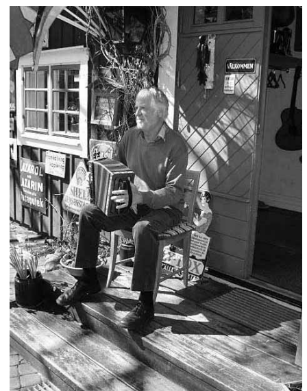
Broddeparn själv på dragspel