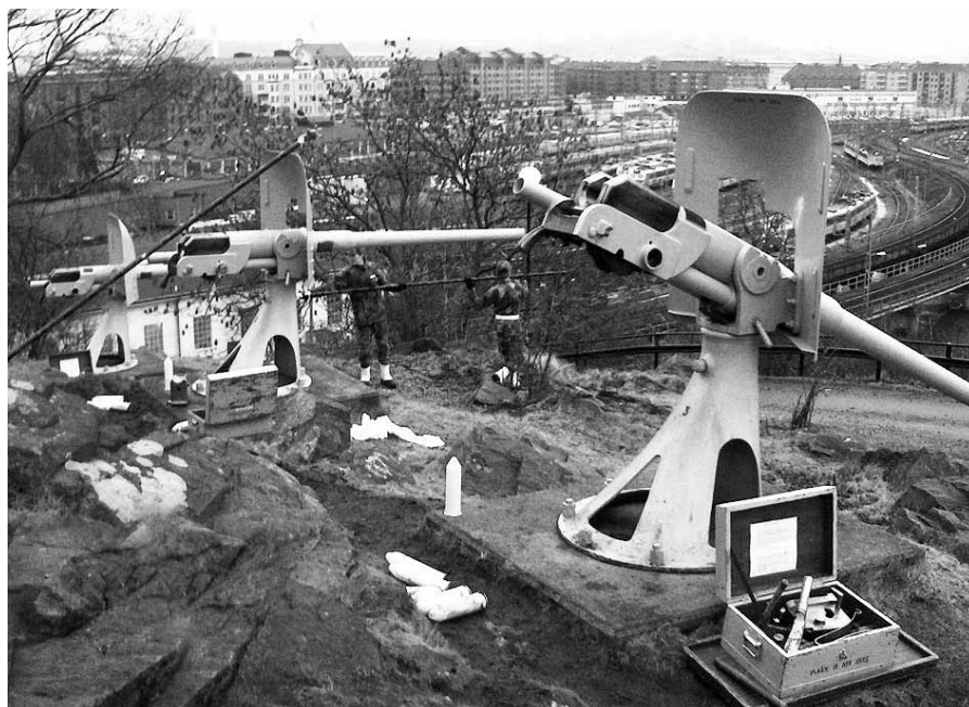
Våra 57 mm salutkanoner m/1889 under vård efter skjutning vid Skansen Lejonet