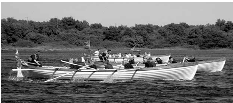
Ädel tävlan i sjömanskap

Marinen erbjuder normalt Sjövärnskåren att under juli månad besätta ett antal elevbefattningar i något av skolskeppen Gladan eller Falken. Krav är att vara medlem i SVK och att ha genomfört FK med omdömet ”lämplig för vidareutbildning”. Ett internationellt ungdomsutbyte för ISCA, International Sea Cadet Association, bedrivs varje år med ett flertal