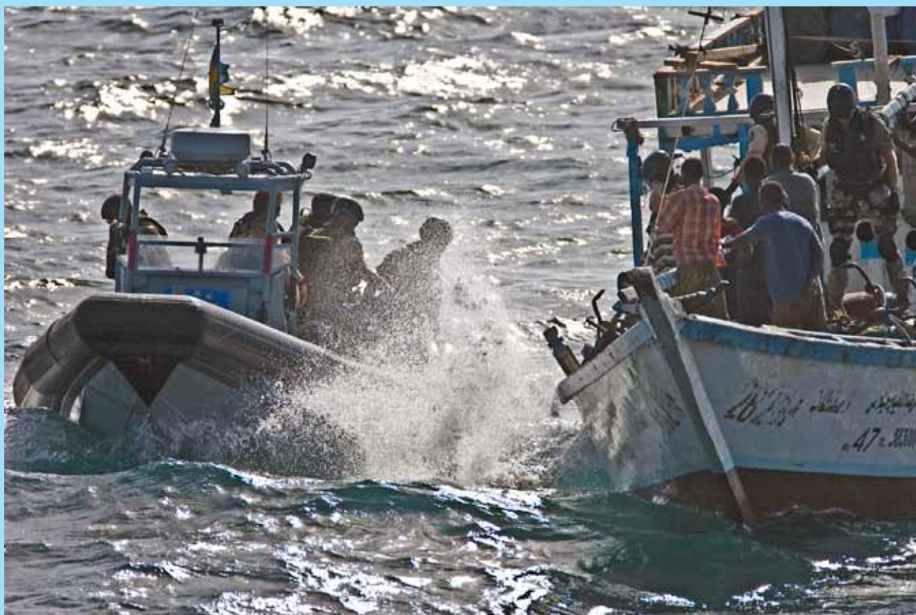
Dramatisk piratjakt utanför Somalia i operation Atlanta. Läs reportaget under Gbg Garnison Kamratförening.