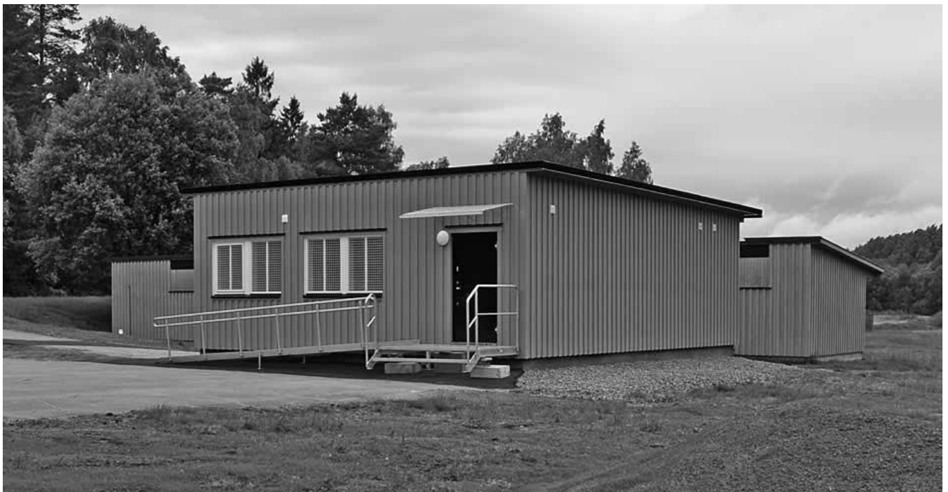
Vår nya lokalitet på Säve