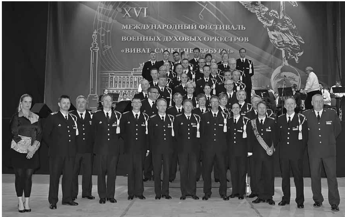
Hemvärnets Musikkår Göteborg

Helgen 27-28 maj var Hemvärnets Musikkår Göteborg i Sankt Petersburg, Ryssland, för att representera Sverige i tre evenemang som arrangerades samma helg. Den 16:e upplagan av "St Petersburg International Military Brass Bands Festival" och "St Petersburg 308 år" genomfördes som en del i firandet av den "Ryska militärmusiken 300 år".