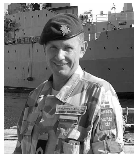
Författaren på kajen i Djibouti