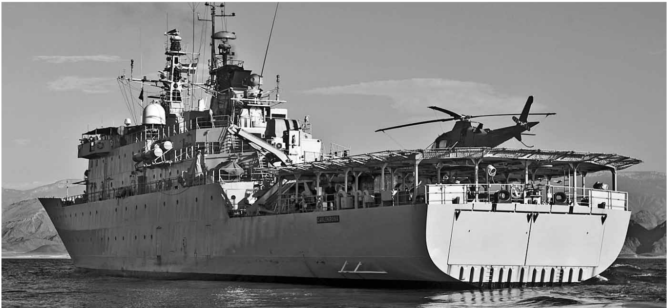
HMS Carlskrona utanför Afrikas kust.

av hårt arbete men också lite trevligheter. En av de uppgifter jag arbetade mycket med var att kontinuerligt lösa diplomatiska knutar av olika dignitet. Att exempelvis få införseltillstånd för reservdelar i Tanzania var en av våra svåraste men samtidigt viktigaste uppgifter eftersom fartyget annars inte hade kunnat fullgöra sina uppgifter. Att se elefanter korsa en väg på några meters avstånd under en safari i Kenya var stort, och att höra de duktiga fältartisterna rocka loss på helikopterplattan ombord under stjärnorna var också en höjddare.