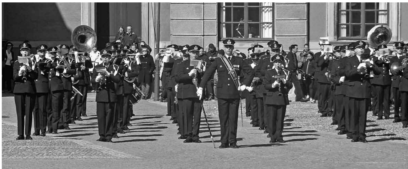
Musikkårerna på yttre borggården vid Stockholms slott.