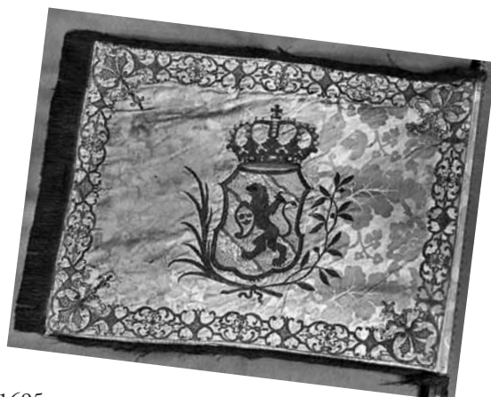
En av Göteborgs borgerskaps fanor

Sista gången militärkåren blev uppkallad till fästningsverkens försvar var vid den norska härens framryckning mot