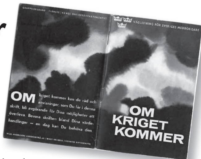
Skriften från Försvarsstaben har omarbetats flera gånger

Därför: Att aktivt delta i motståndsrörelsen kräver mod och goda nerver. Ge inte fienden något som helst bistånd... Avstå från personligt umgänge med