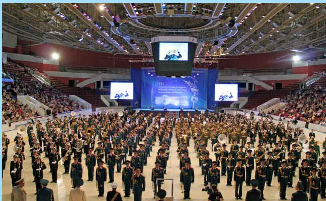
Uppställning av nio musikkörer i St Petersburg i samband med den stora International Military Brass Bands Festival i maj 2011. Läs rapport under Elfsborgsgruppen.