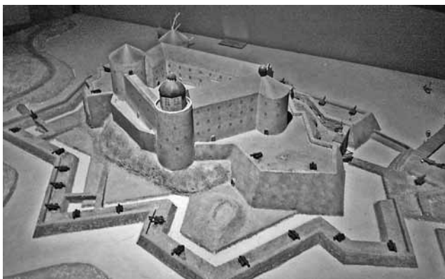
Älvsborgs Slott på 1620-talet