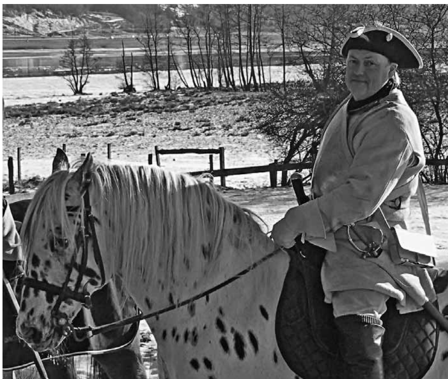
Författaren till häst

Föreningen är under stark tillväxt och har nyligen bildat en stab för att få alla föreningens delar att bli samspelade. Staben har även en viktig roll vid evenemang och andra uppvisningar att bilda stabsplats för det historiska spelet men även som informationsplats för publik. Vi har som mål att kunna i första hand agera i Västra Götaland med våra fäst-