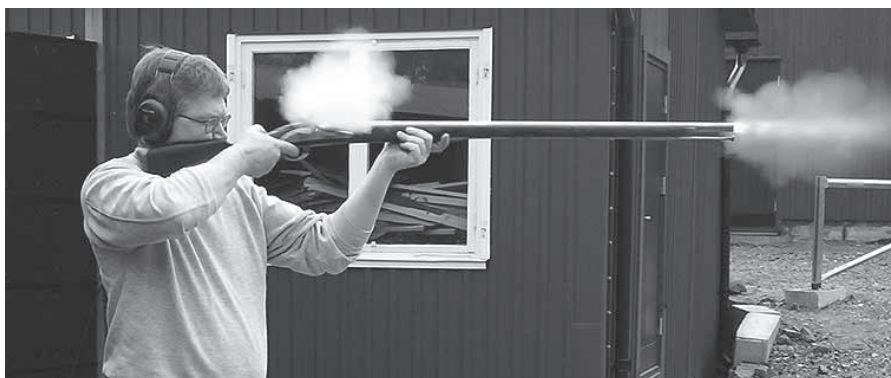
Urban skjuter här med en replik av ett Brown Bess (1762) med kaliber .76 (19,05 mm)

Genom att föreningen är medlem i Svenska Svartkruts Skytte Federationen, SSKF, kan vi erbjuda skytte inom alla deras tävlingsformer. Tyvärr medger bara Sisjön skjutfält, Mölndals SF och Volvo