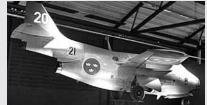
J29 – Flygande tunnan

På nedre våningen finns kanske det mest intressanta, DC-3:ans sista resa. 1952 försvann ett svenskt spaningsplan av typ DC-3 med åtta man ombord under en flygning över Östersjön. Efter år av lögner och förnekanden erkände Sovjetunionen 1991