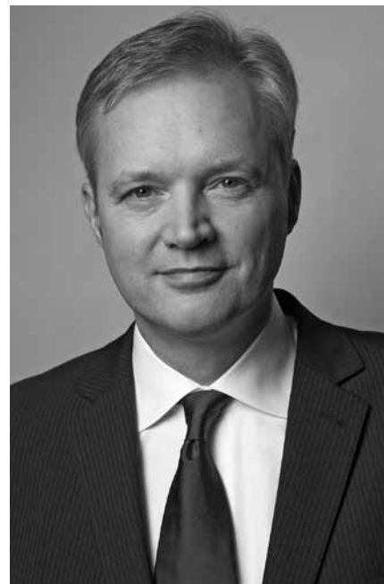
Försvarsminister Sven Tolgfors

Försvarsministern ser inga svårigheter att rekrytera soldater och sjömän till vårt nya försvar. Det har visat sig att den nuvarande rekryteringen hittills gett ca 22.000 sökande till 2.400 platser. Dessutom är det ca 12-15% kvinnor bland de sökande. Målsättningen att ha genomfört