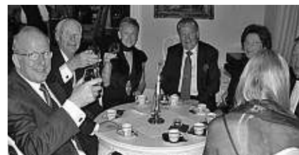
Kaffe med avec avslutade den grandiosa måltiden