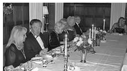
Honnörsbordet vid höstmiddagen