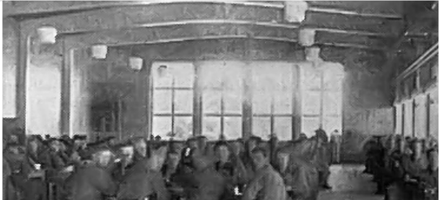
Den nya vackra matsalen