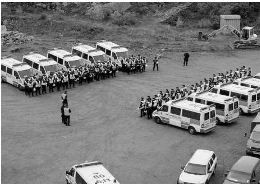
Polispatruller uppställda inför övning

Verksamheten är helt i linje med statsmaktens inriktning. Som ett exempel på detta citeras budgetpropositionen för 2012: ”Mot bakgrund av regeringens förslag om avveckling av beredskapspolisen finns behov av att polisen och Försvarmakten övar tillsammans för att skapa effektiv användning av förstärkningsresurser.”