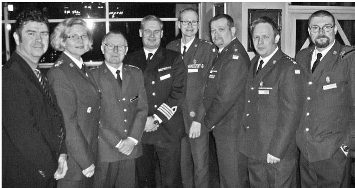
EBG:s tingsdelegater med garnisonschefen och riksdagsledamoten Stefan Caplan

Utöver sedvanlig mötesordning innehöll merparten av tingsutskottsarbete för att behandla de 76 motionerna och två motionerna. Utöver detta besöktes tingsutskottet av försvarsministern, ÖB samt ordföranden i Försvarsutskottet, som alla gav sin bild av Försvarsmakten och i synnerhet Hemvärnet.