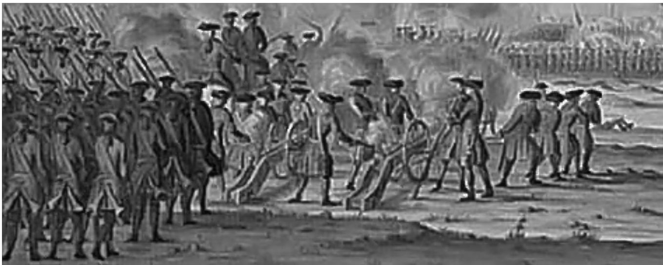
Cronstedts kanoner 1712

Den lilla orten Gadebusch ligger 30 km SV om Wismar i det tyska furstendömet Mecklenburg. Här utkämpades den 9 december 1712 ett slag mellan svenska och dansk-sachsiska trupper om det vacklande svenska stormaktsväldet. Vår förening ordnar en resa dit sommaren 2012 för att fira segern för 300 år sedan.