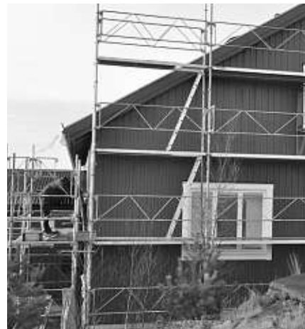
Hemvärnshuset med fasadrenovering