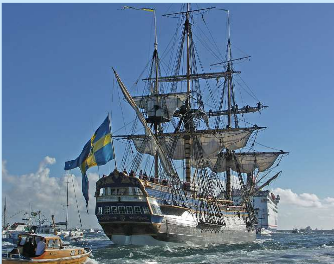
Ett annat stolt skepp, Götheborg, på väg på jungfruresan 2005.