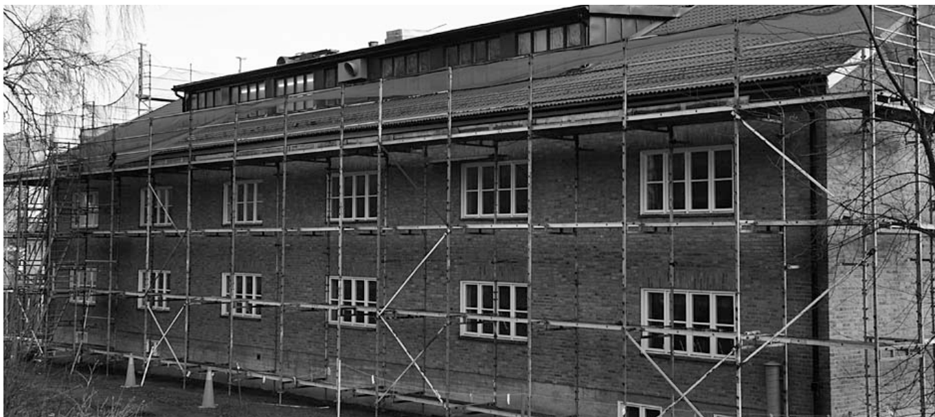
Kasern D omdanas