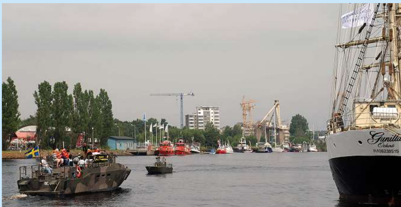
Båtkompaniet serverar vid Tall Ships Race

B POSTTIDNING ÄLVSBOGARN Försvarsmedicincentrum Box 5155 426 05 Västra Frölunda