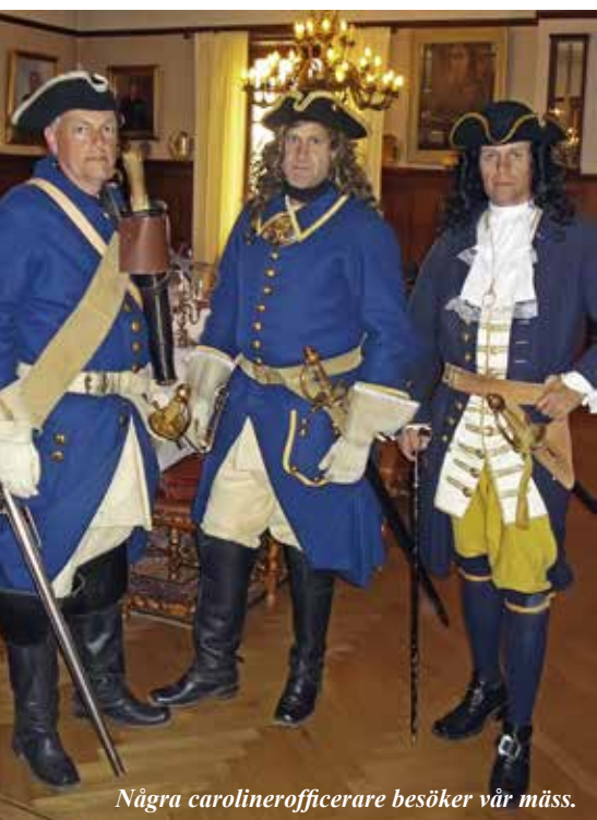
Några carolinerofficerare besöker vår mäss.