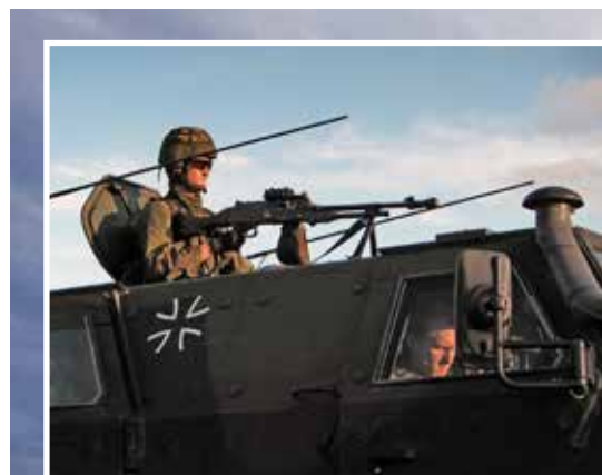
Tysk pansarterrängbil "Dingo", här bemannad av en svensk amfibiesoldat med Ksp-58.

”I gryningen landsteg fyra skyttegrupper.