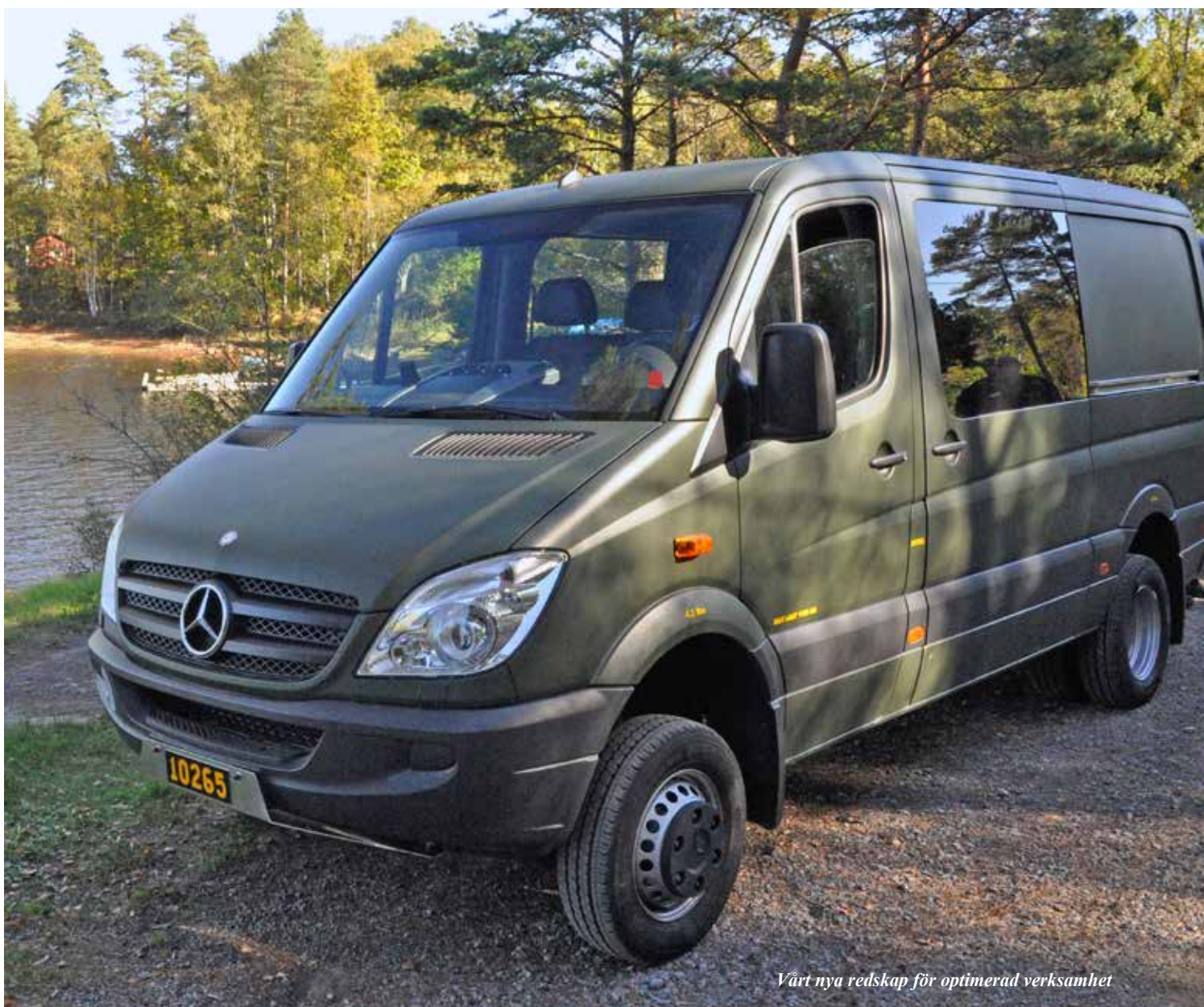
Vårt nya redskap för optimerad verksamhet

leds av befintlig personal på Stora Holm, men det är vi som är övningsledare och ansvariga på plats. Man kan säga att bilarna var mycket stabila vid halkkörningen, men när de kommer upp i hastighet så märker man av deras stora tyngd.