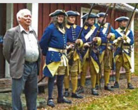
Carolinererna intar Laddatorpet

Kamratföreningen har fått in en ny avdelning Kongl Elfsborghs Caroliner som har lierat sig med vår förening. En naturlig utveckling då Göteborgs och Västsveriges försvar är det centrala för oss. Vi hälsar Carolinerna välkomna i kretsen! De kommer att få husera i Laddatorpet. De fick högtidligt nyckel till torpet i samband med den plan-