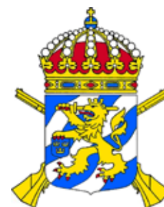
Älvsborgs regementes vapen domineras av det grönta lejonet på skölden med "trenne silfverne strömmar"

■ ORDEN REGERING och regemente härleds båda från latinets regere i betydelsen härska, kontrollera. Förbandstypen utvecklades på 1600-talet och avsåg inledningsvis ett krigsförband omfattande 500-1500 soldater beroende på om det var ett kavalleri- eller infanteriförband. För specialtruppslagen kom det tidigt att bli ett samlingsbegrepp för hela truppslaget. Så var t.ex. de tusentals kanoner som utgjorde det svenska artilleriet under perioden 1636-1794 samlade i ett artilleriregemente.