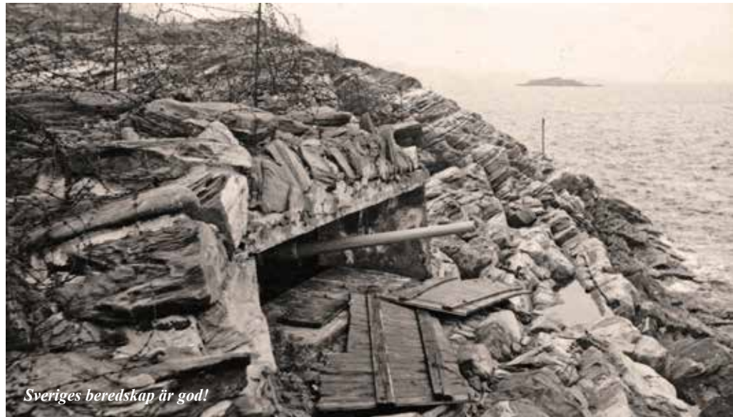
Sveriges beredskap är god!