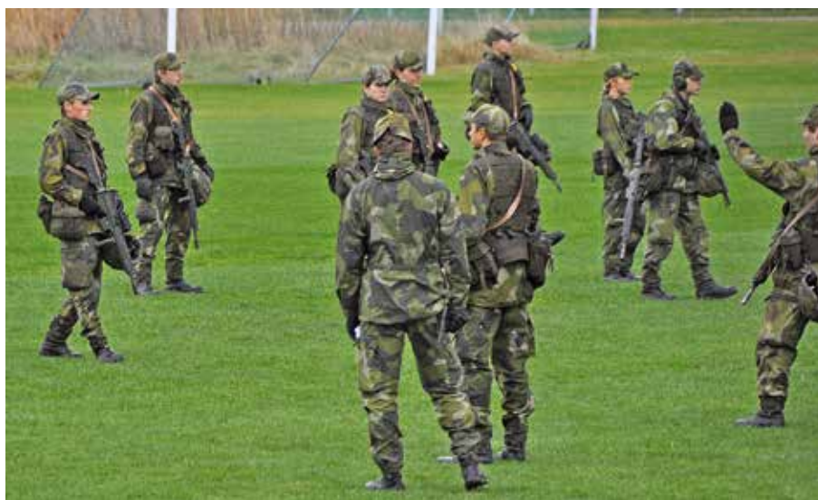
GMU-rekryter under utbildning i postjäms

► NU, 10 ÅR SENARE , konstateras att Nya Älvsborgs hemvärnsbåtkompani har minst dubbelt så många certifierade stridsbåtsförare som systerkompanierna i Blekinge och Stockholm.