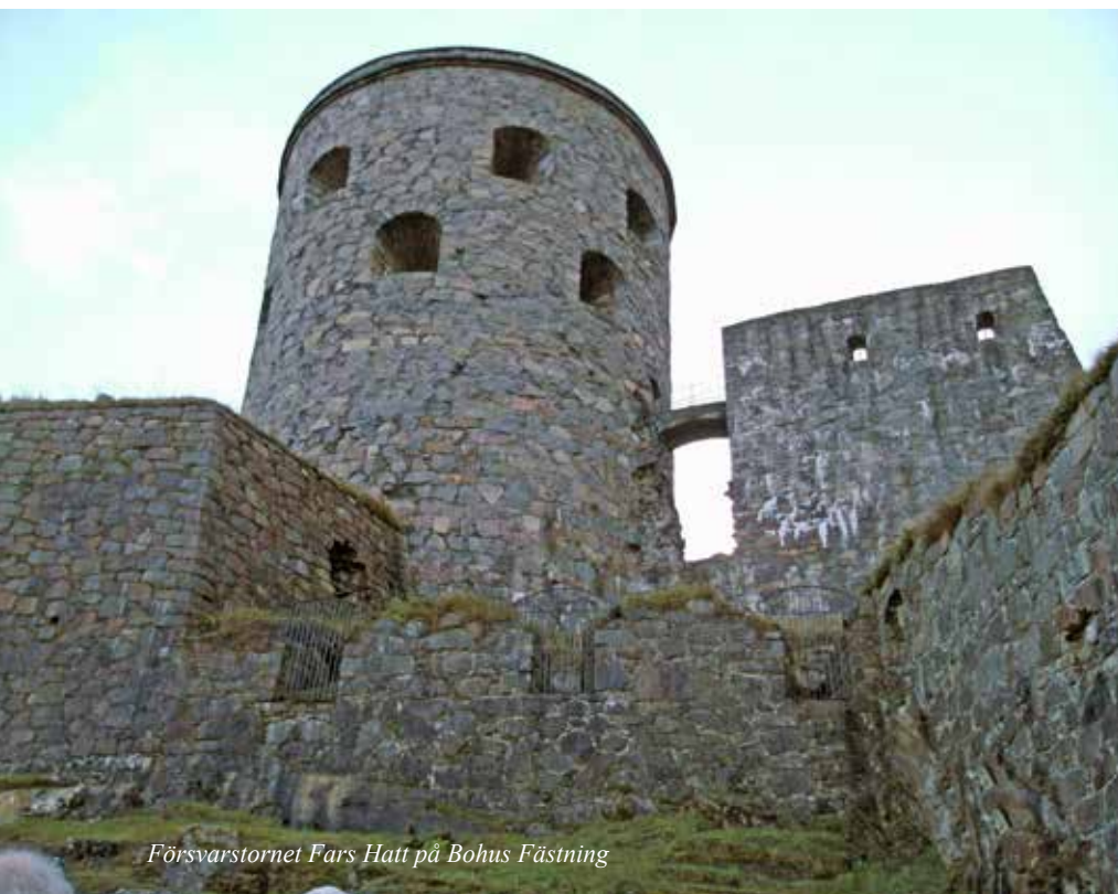
Försvarstornet Fars Hatt på Bohus Fästning