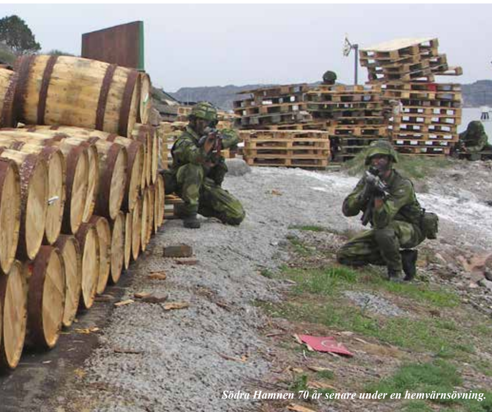
Södra Hamnen 70 år senare under en hemvärnsövning.

Vid ett tillfälle började vi se ljusglimtar från ett ställe på Skaftölandet, och plötsligt en kväll såg vi, hur det kom signaler utifrån havet. Det blev samarbete med polisen och en morgon, när torghandeln hade börjat, fick två, till synes civila och oklanderliga, medborgare följa med polisen, för vidare transport till Göteborg. Signalerna upphörde.