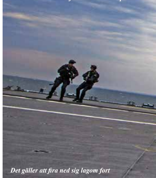
Det gäller att fira ned sig lagom fort

tyg skulle kunna fälla på exakt rätt tid och plats.