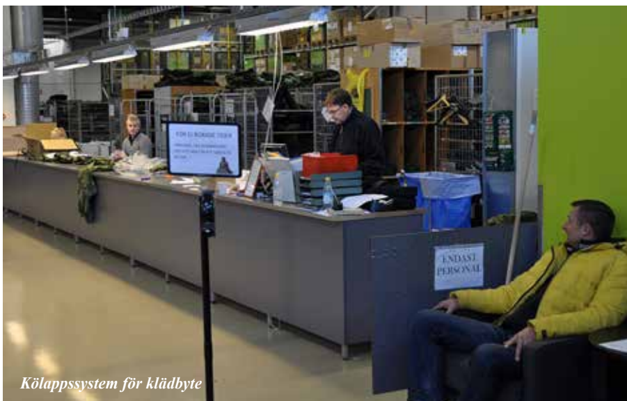
Kölapssystem för klädbyte