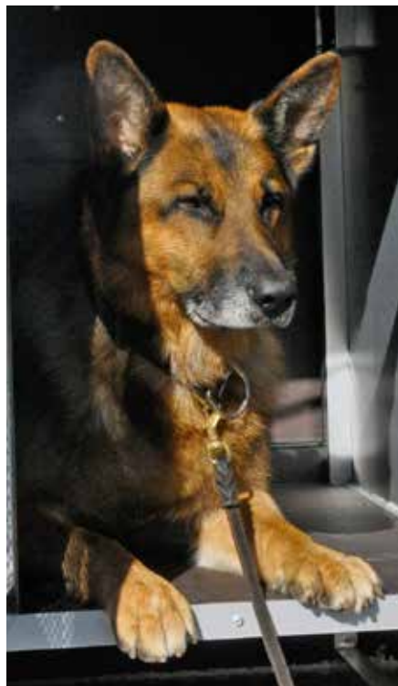
Våra spårningsexperten har det gott i nya bilen

Då samtliga hade förarbevis sedan tidigare så blev kursupplägget mer av praktisk karaktär än teoretiskt. Dag ett var det presentation av fordonet där eleverna fick ett frågeformulär med frågor som skulle besvaras. Under cirka två timmar var det mycket letande efter varningstrianglar, domkrafter, reservhjul m.m. Även glödlampsbyte fram och bak stod på menyn. Efter detta var det genomgång av åtgärder före körning, säkerhets-