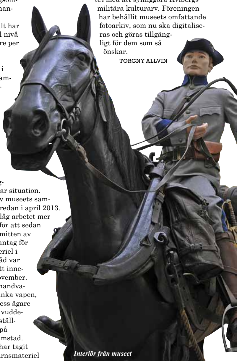
Interiör från museet