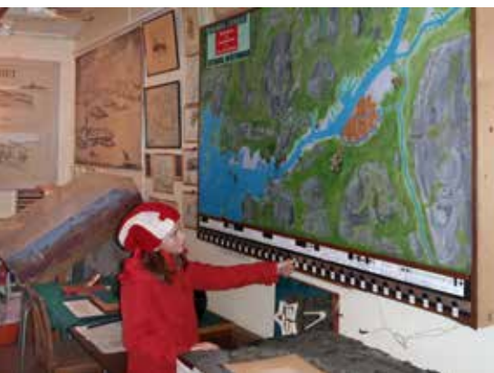
"Framtiden" undersöker "historien" på tavlan med skansarna

NÄR JAG SATTE rubriken "Historien möter nutid och framtid" var det definitivt inte jättegänget jag tänkte på som historia. Nej, när jag nu kommit ner, till mitt i Fortbacken, har jag hamnat vid Göteborgs Garnisons Kamratförenings Traditionsrum. Här känner jag verkligen historiens vingslag. Det finns modeller av de riktigt gamla stadsbildningarna vid Göta Älvs utlopp med de olika försvarslinjerna markerade. Man kan följa utvecklingen via ljustavlor med knappsatser för att tända lampor som visar de olika stadierna. Här finns också fotografier, dokument, böcker, uniformer och, sist men inte minst, materiel från hela Kustartilleriets historia. Skrämmande att se hur mycket av den materiel jag jobbat med under min aktiva tid från 1960 och framåt, som nu är uråldriga