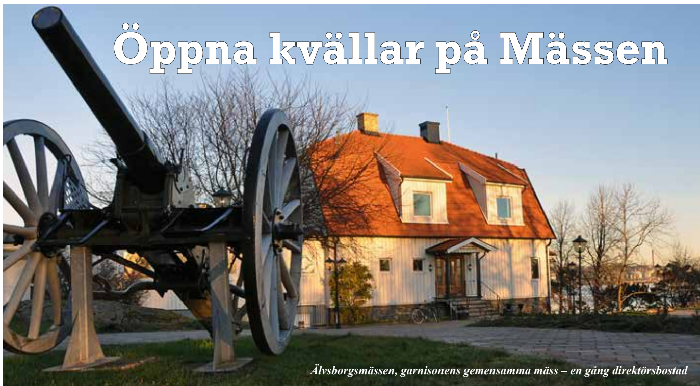
Ålvsborgsmässen, garnisonens gemensamma mäss – en gång direktörsbostad

■ GÖTEBORGS GARNISON och dess personal insåg tidigt vikten av en hög social samvaro i det nya personalförsörjningssystemet, och att detta ställer nya krav på trivsellokaler och dess utnyttjande. Ett viktigt ingångsvärde i Göteborg är att förbandet har friliggande kompanikaserner. Vart och ett av garnisonens tre heltidsanställda insatskompanier disponerar var sin sådan kasern. I dessa har det på vindsvåningen iordningställts pentry där den fast anställda personalen kan värma och äta medhavd mat om så önskas. I omedelbar anslutning till respektive pentry har en lektionssal iordningställts som dagrum. Förhoppningen är att utveckla dessa lokaler på ett sådant sätt att de kan klassificeras som förbandsmässar.