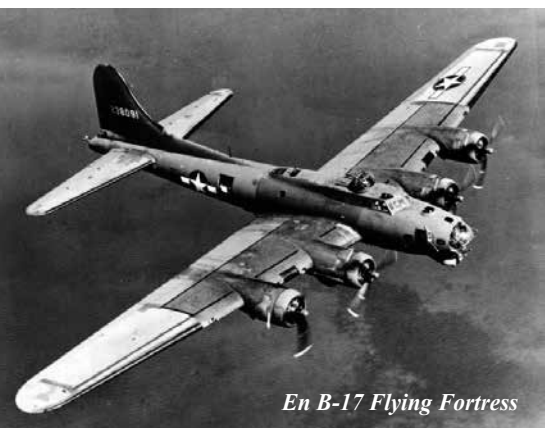
En B-17 Flying Fortress