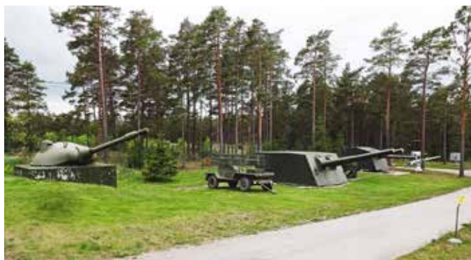
Fast och rörlig KA-materiel från gotländska förband