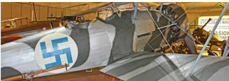
Störbombaren Hawker Hart tillverkades 1942 på Götaverken. Finlands flygvapen hade blå svastika till 1945.