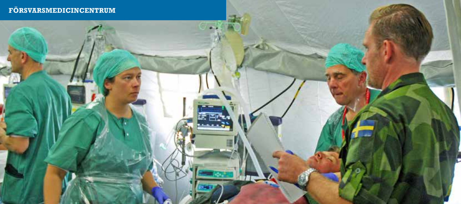
Kirurgtroppen under övning