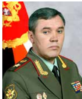
Valerij Gerasimov är Rysslands generalstabschef och biträdande försvarsminister

den lär sig samverka i strid och lär känna varandras system och egenskaper. Men sådana planer som kan ligga till grund för gemensamma operationer i olika lägen i krig blir det som sagt inte.