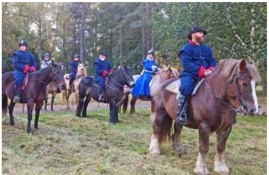
Wästgöta ryttare var med även denna gång