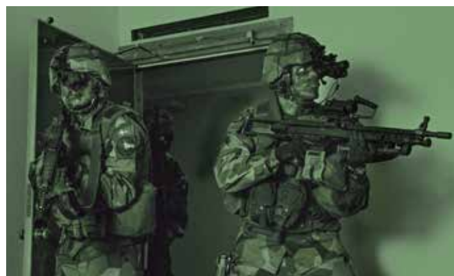
Bildförstärkare på ena ögat ger god kontroll i mörker