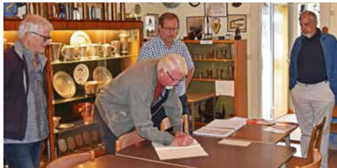
FHT-gänget i sällskapsrummet