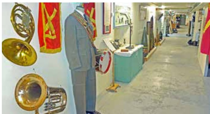
KA-korridoren börjar blir presentabel, men blir väl aldrig helt färdig