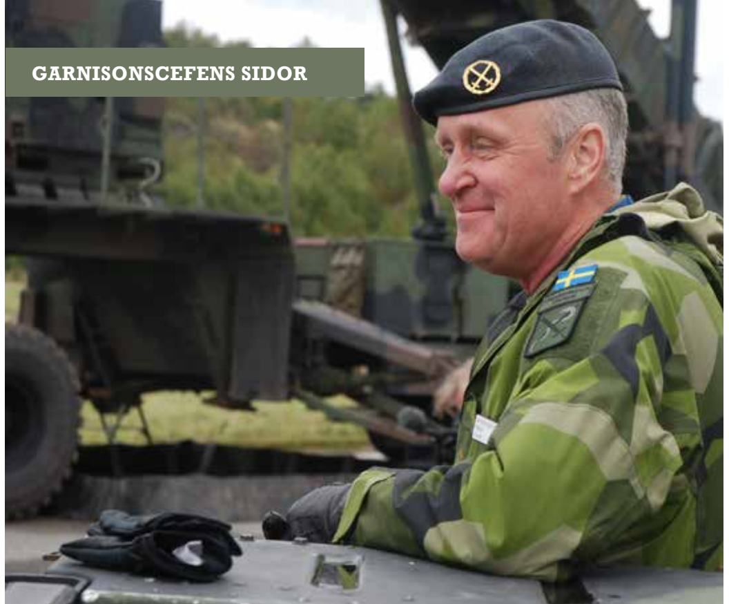
Nöjd garnisonschef på Säve