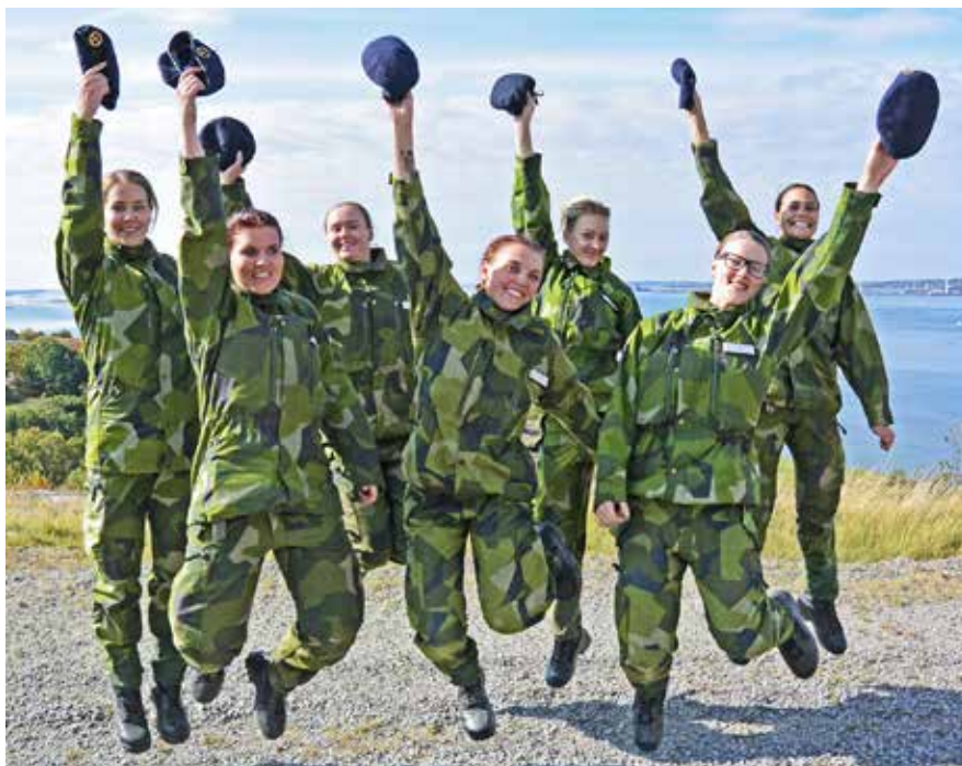
Omslagsbilden 2-16 visade baskerceremoni för ett gäng som klarat GMU

Här på kompaniet utbildar vi rekryter till hemvärnet samt att det planeras för att årligen ta emot rekryter till Amfl:s krigsförband på Kärningberget; 17. Bevakningsbåtskompaniet och 132. Säkerhetskompani sjö, eller mot 1. och