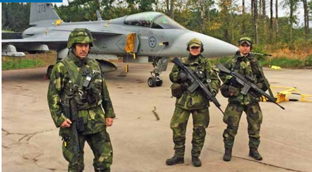
Ett Jas-plan kostar hundratals miljoner

Aurora innebar en komplexitet som vi inte varit med om förut, skarpt läge, löst läge, samverkan, bevakning -objekt. -område, -flygplan, ytövervakning, inpasseringskontroll, vaktjänst, eskort, ta objekt och mycket mer. Vi har mobiliserat, kompletteringsutbildat, genomfört tilltransport, fått ett överlämnande, gjort ett övertagande, löst uppgift, avvecklat, genomfört hem-