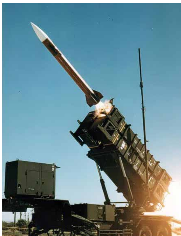
Patriot styrs av extremt avancerade radarsystem och kan bekämpa rörliga flygmål

” A good plan violently executed now, is better than a perfect plan executed next week. George S. Patton.