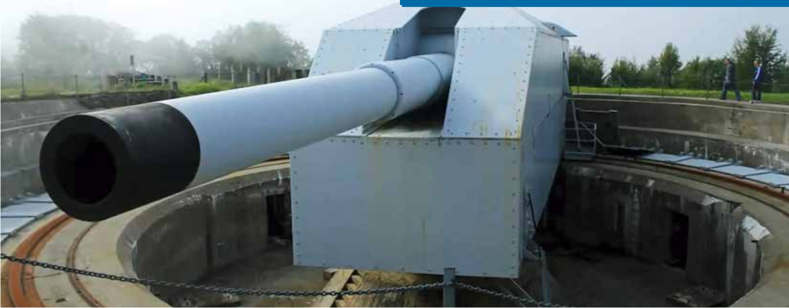
Enbart eldröret på en Adolfkanon väger 159 ton