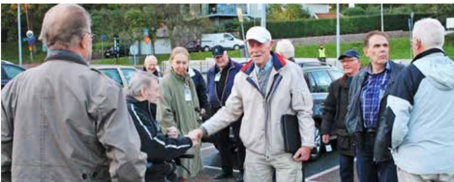
Samling på Käringberget