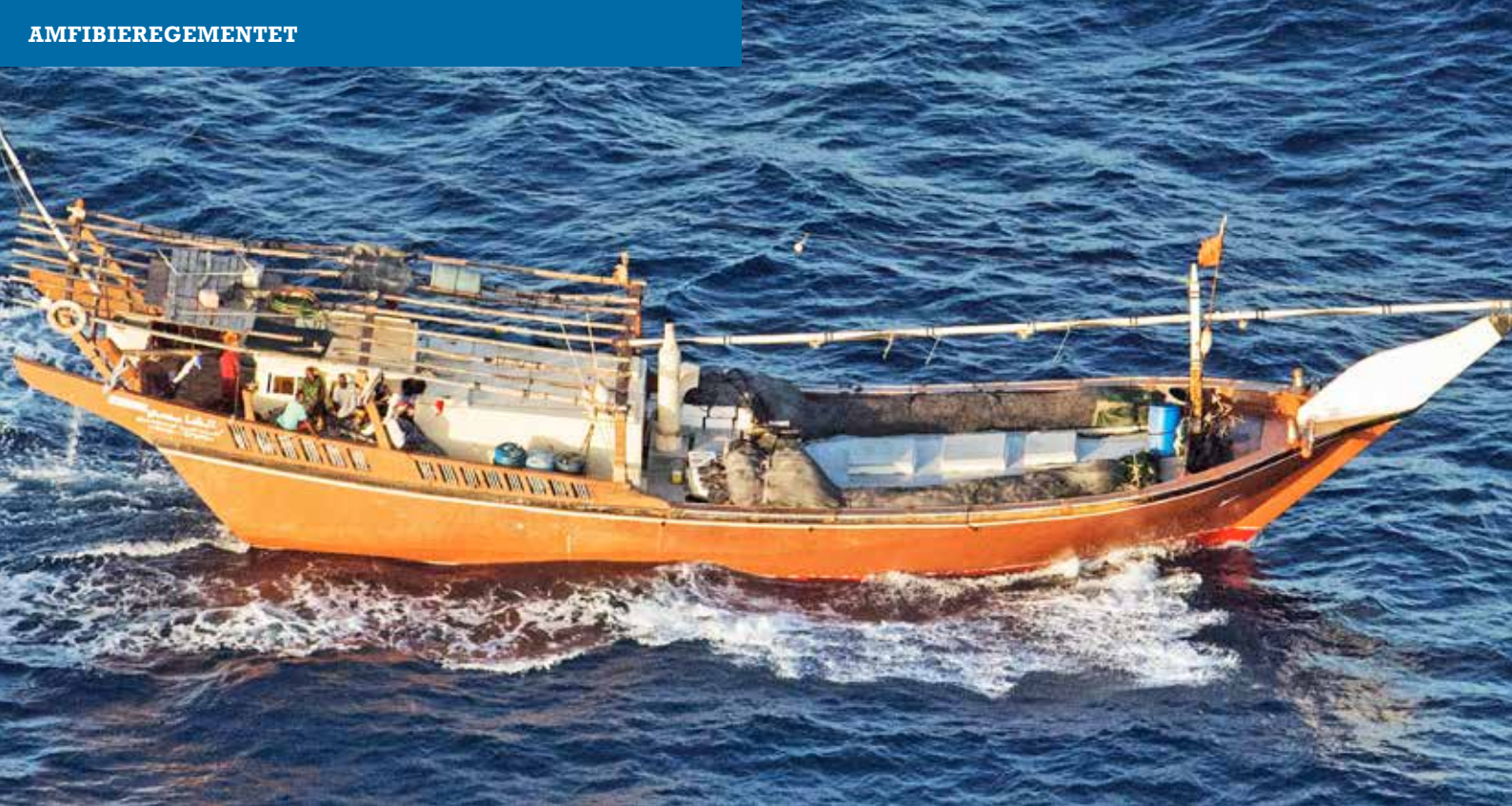
Traditionell havsgående dhow utan segel på spristången under fiskefärd?