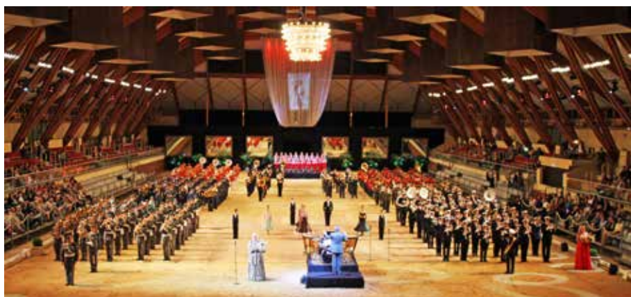
Musiken i Cadre Noirs arena

I tattooprogrammet marscherade musikkåren in till vår egen marsch "Göteborgs Hemvärns Marsch" och ut till "Manövermarsch" – före detta Väst-kustens Marinkommandos. Det stående konsertprogrammet bestod av ett