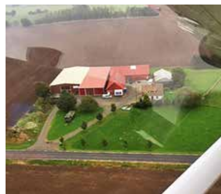
Flygspanaren kan snabbt skanna markobjekt