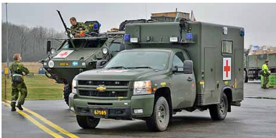
Pansarterrängbil 203 och Chevrolet militärambulans