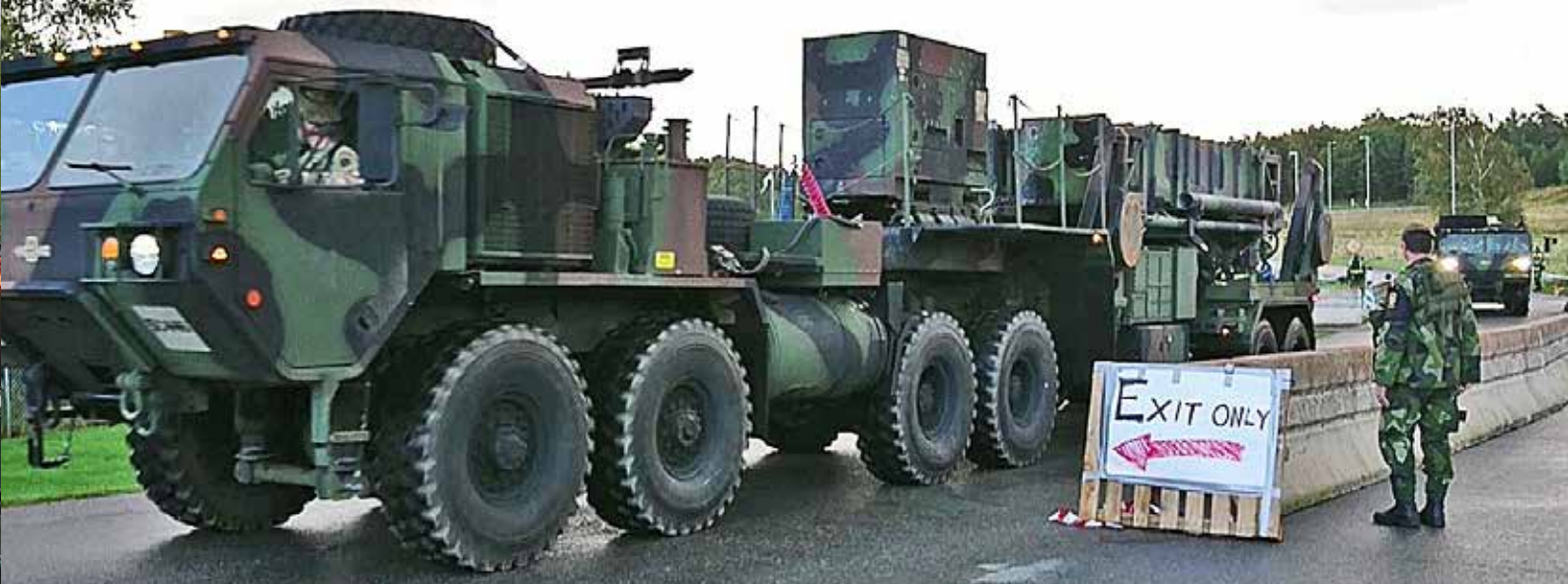
Lavettlastbil med Patriot lämnar Säve