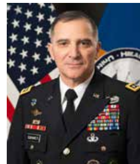
Curtis "Mike" Scaparrotti är NATO:s och USA:s högsta befälhavare i Europa