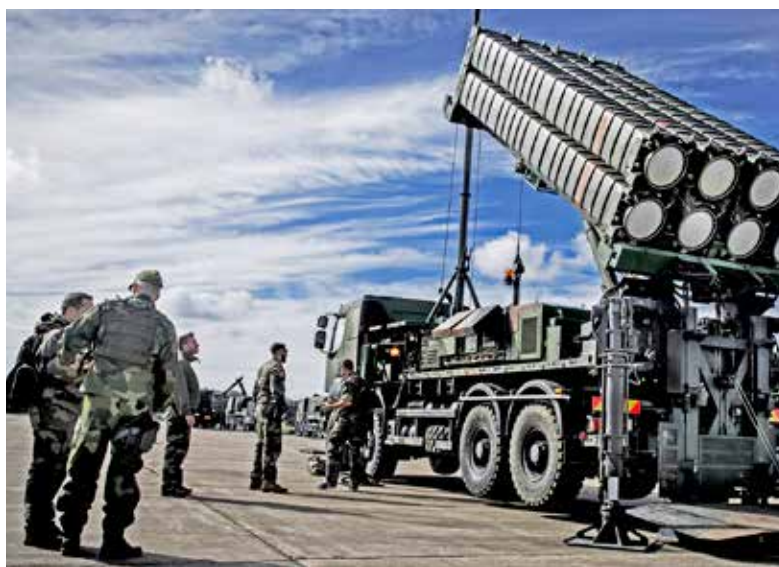
Fransk lavettlastbil med åtta Aster 30 SAMP/T under gruppering. Bild FM.