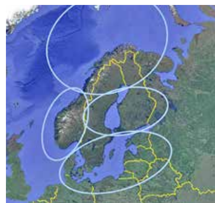
Områden med behov av samordnad ledning