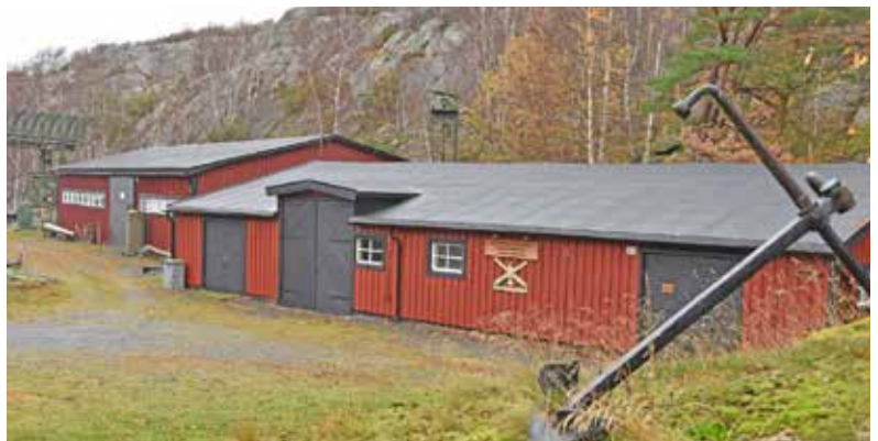
Besök Tradrummet på onsdagar, se nästa sida!