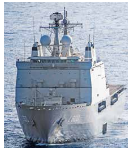
HMS Rotterdam med sina 166 meter är vårt hem under uppdraget

KN JOHANNES KINGHED C BORDNINGSTROPPEN ME05 FOTO COMBAT CAMERA