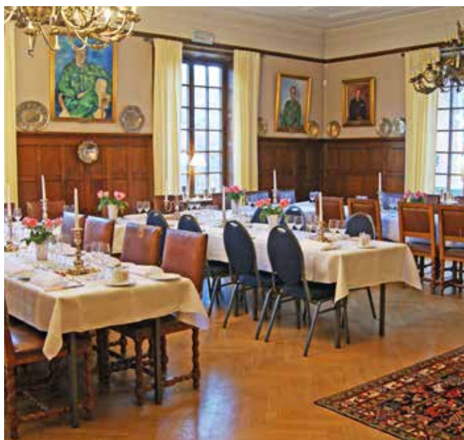
Vår eminenta mäss uppdukad för middag