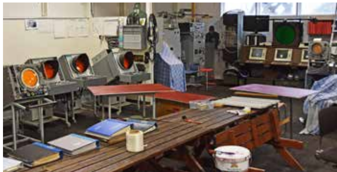
De fungerande radarskärmarna från 40-talet får nya platser