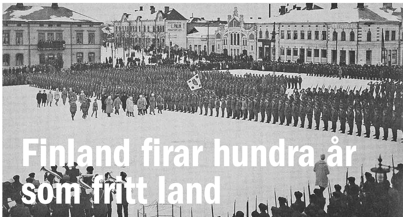
Vita jägarkårer i Vasa 1918

Naturligtvis firar vi med dem. Vi har uppmärksammat detta med två artiklar i Älvsborgaren och här en tredje artikel i Älvsborgarna.