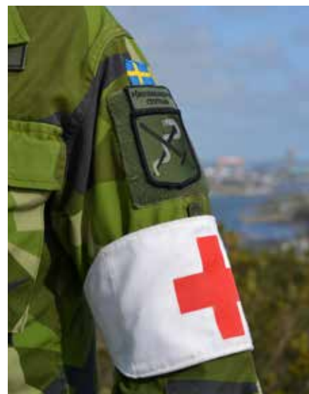
Det Röda Korset skall skydda den som bär det!

Andra pekar på att teknikutvecklingen med smartphones, drönare, internetbaserade medieplattformar och