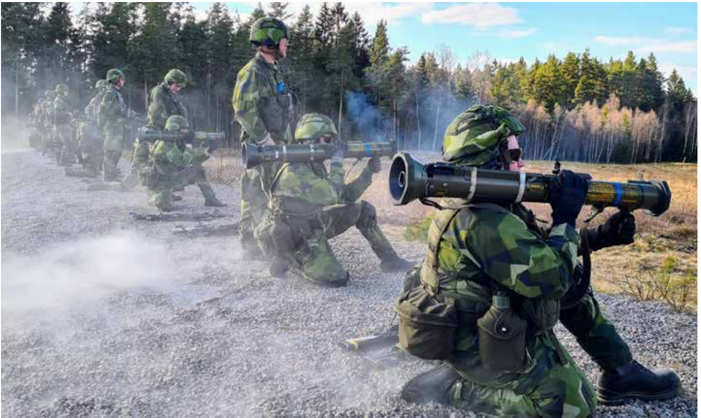
SÖF med 44. bat v 216.

hantera det ökade tillflödet. Vid årsskiftet 2021–22 hade vi cirka 400 personer med nya ansökningar att hantera. Även vid årsskiftet noterades en ökning som var påverkad av omvärldsläget anspänning. Ansökningarna ökade under februari och gick spikrakt upp efter krigsstarten den 24 februari med det ryska angreppet. Vissa dagar hade vi över 200 ansökningar varje dag. Totalt har vi nu över 3000 människor som anmält sig till att vara en del av Hemvärnets bidrag till Försvarsmakten. Det är en mycket stor och utmanande uppgift.