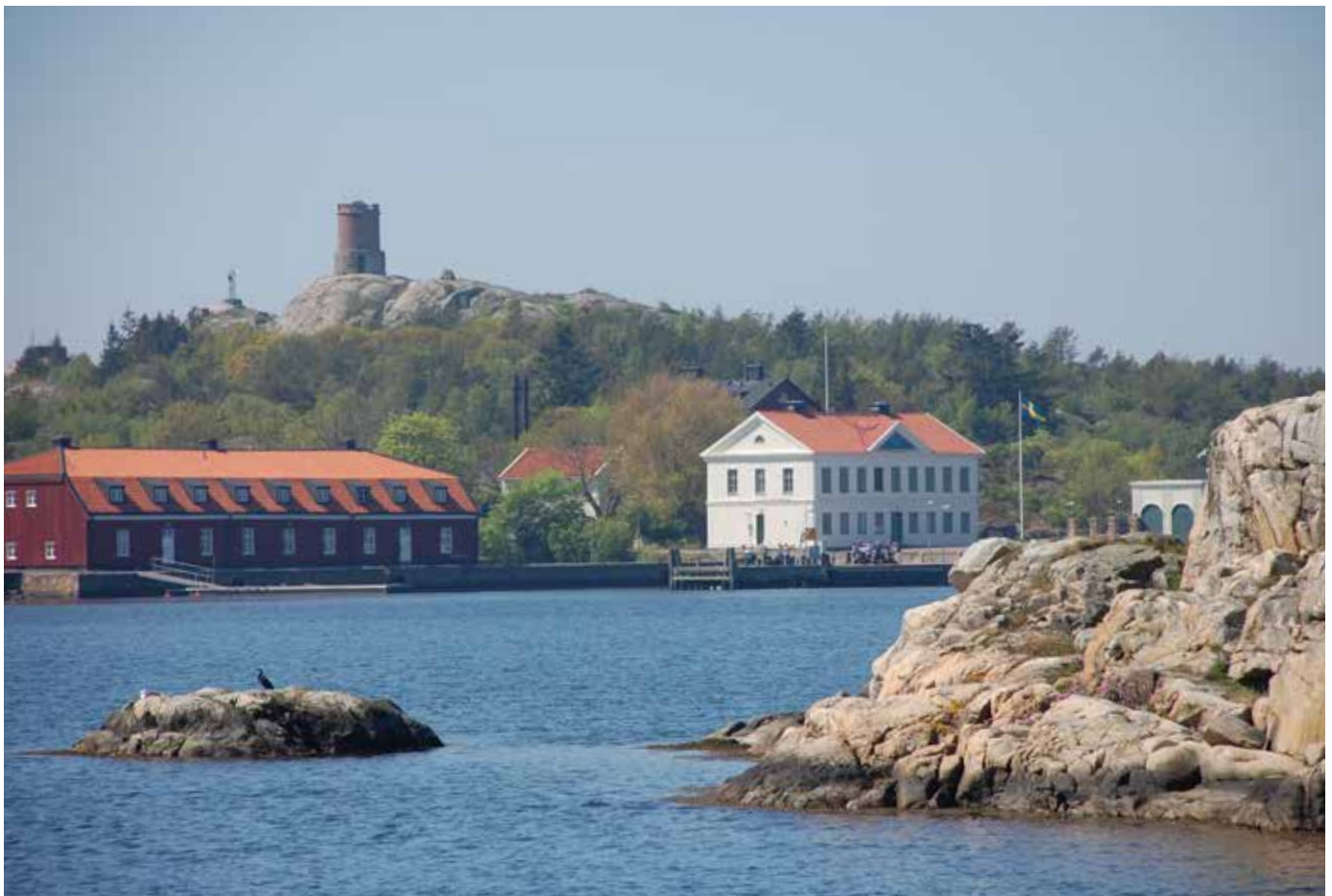
Käsö med parlören bakom klipporna. Parloiren = tala med varandra / I Hamberger.