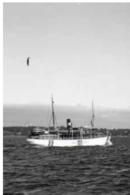
Passagerarfartyget S/S HANSA (1899) med svensk neutralitetsmålning.