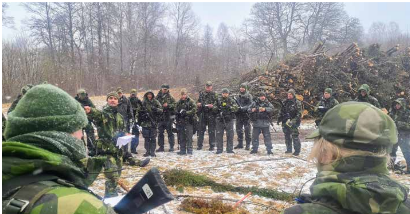
Ordergivning, gruppchefs kurs 1 v 213-214.

hemvärnschefen har kraven på uppfyllnad till minst 80% före halvårsskiftet 2022. Vi efterlever det mycket på grund av att vi genomförde en kraftsamling på skyddsvaktsutbildningar här om året. För att säkerställa efterlevnad hos alla förband har vi även här fått "lägga in en extra växel". Våra åtgärder är och har varit;