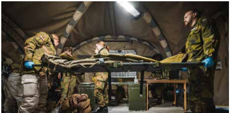
En norsk och en svensk sjukvårdssoldat för in en "skadad" till det multinationella fältsjukhuset under övningen Cold Response 2022.