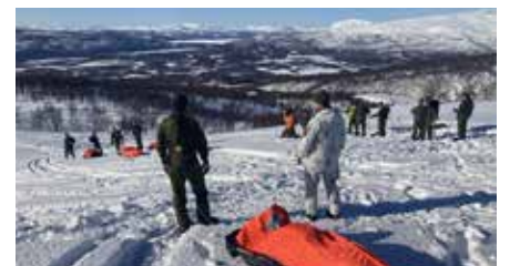
Stridsflygelever efter nödutsprång i fallskärm.