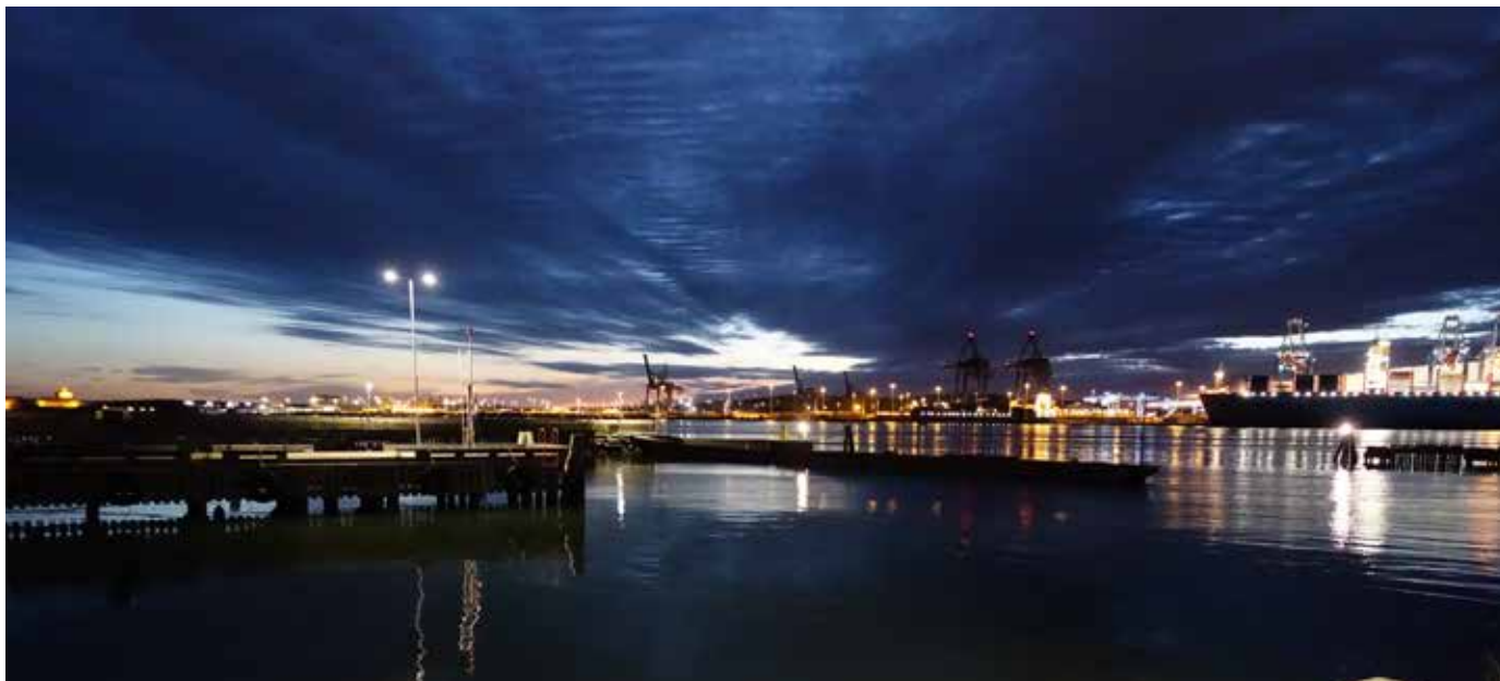
Göteborgs hamn.