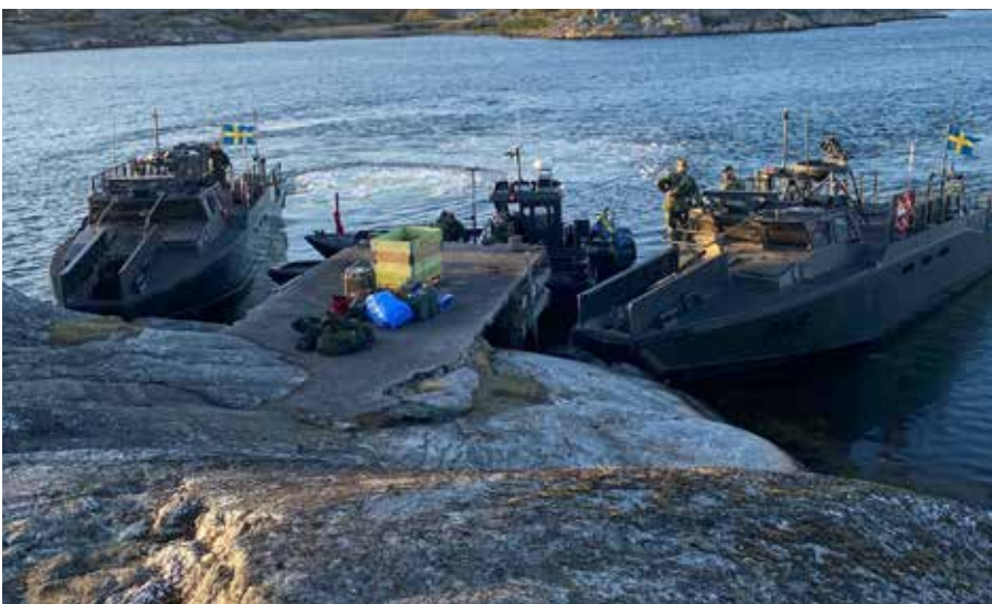
SÖF med 44. bat v 216.