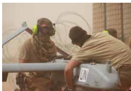
Tekniker genomför åtgärder efter flygning på UAV03, Camp Nobel Mali