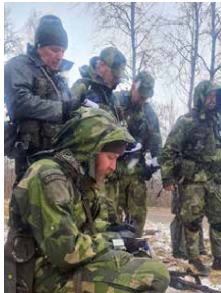
Ordergivning, gruppchefskurs 1 v 213-214.

Under Uniform på jobbet-dagen bar tusentals hemvärnssoldater sin uniform på arbetsplatser runtom i Sverige. C EBG Peter Forsberg besökte ett par av Elfsborgsgruppens hemvärnssoldater under dagen.