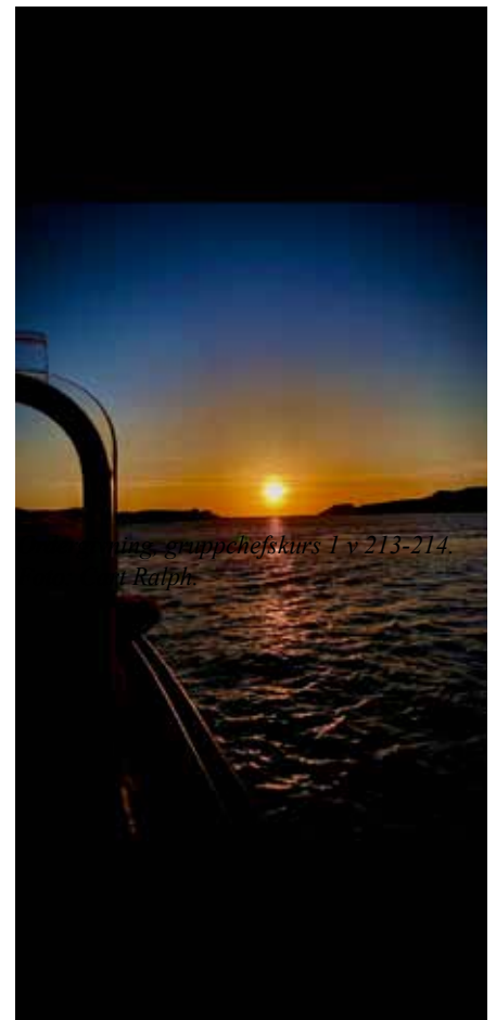
Ordergivning, gruppchefskurs 1 v 213-214.

Söndagen den 8 maj var det dags för den andra och helgens sista vaktparad, för det här bidraget till högvakten. Om