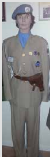
Permissionsuniform FN-soldat i Palestina