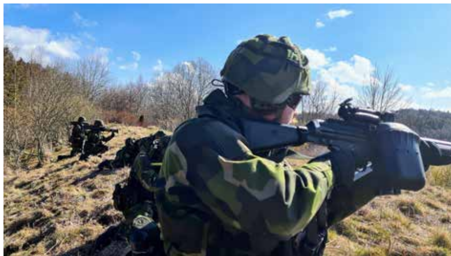
Strid, gruppchefs kurs 1 v 213-214.

Med motivering i det anspända säkerhetsläget, och i syfte att öka tillgänglighet på Hemvärnsförbanden, i alla konfliktnivåer, har Rikshemvärnschefen fattat beslut om att införa ett nytt tjänstgöringsavtal. Det nya avtalet hade målsättning att vara infört