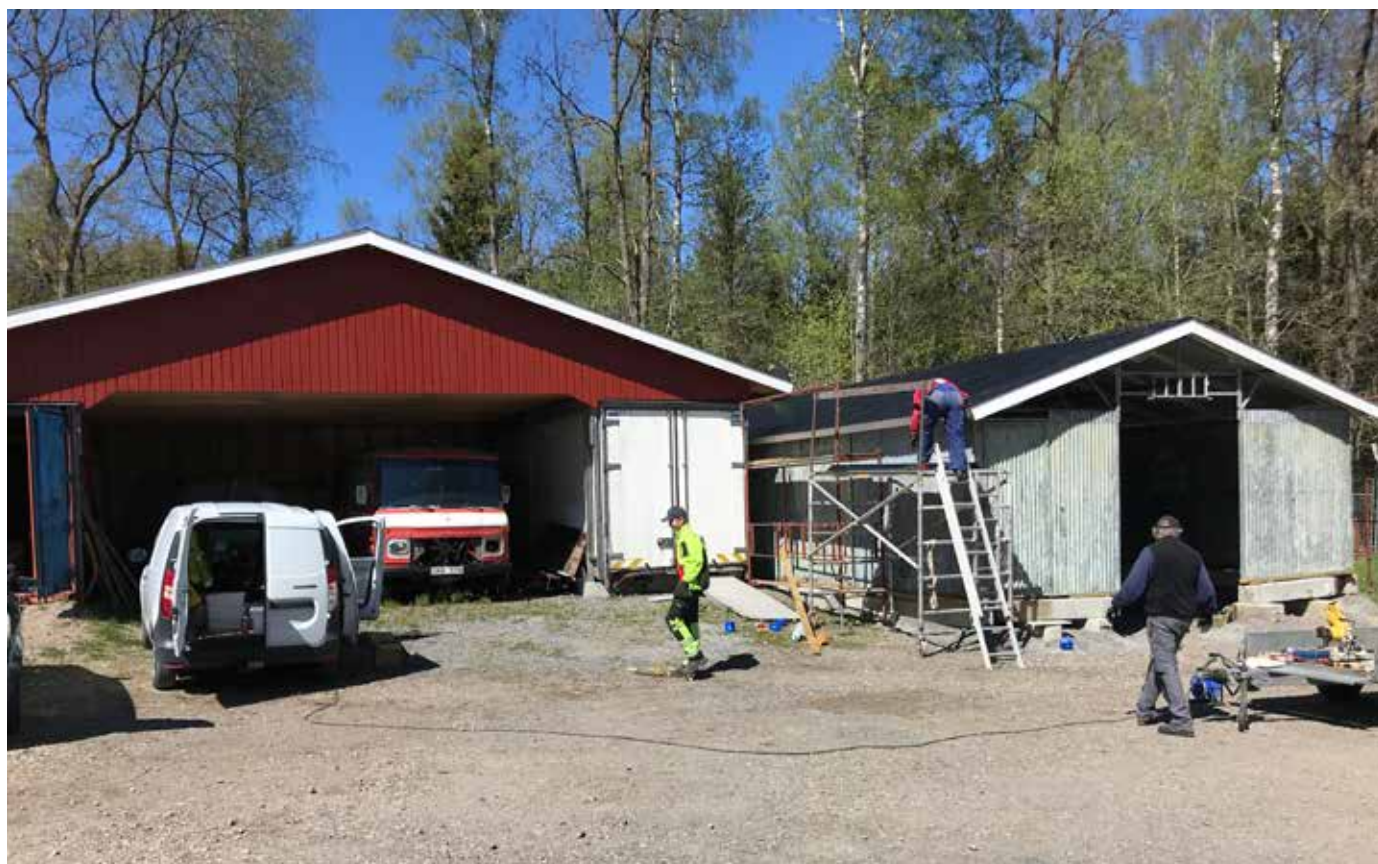
Nytt kallförråd byggs.