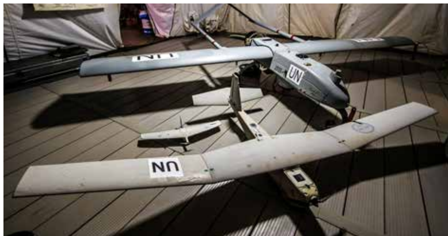
I förgrunden UAV05B och den mindre UAV05A. Bakom dem UAV03, Camp Nobel Mali.

TRPAS (Tactical Remote Piloted Aircraft System) innefattar de större systemen som används på taktisk nivå. Den första farkosten var UAV01 Uggulan som användes mellan 2000 och