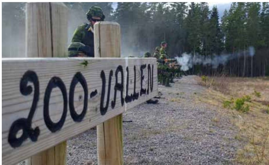
SÖF med 44. bat v 216.

Vi har välutbildade, väl uppfyllda förband med engagerade chefer och personal. Vår enskilt största utmaning är att