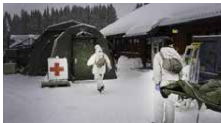
Sjukhusbataljonen i arktisk miljö.