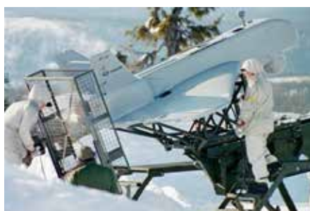
UAV01 Ugglan inför start under övning i Vidsele.

Det smidiga formatet till trots så fick det ofta stå tillbaka för den större farkosten på grund av begränsningar i bl.a. sensor och uthållighet. 2015 utbildades den sista gruppen på UAV05A och den har sedan dess slutförbrukats. Tillverkaren Aero Enviroments betäckning på UAV05B är Puma AE där AE står för All Environment. Systemet är byggt för att kunna verka i alla typer av klimat. Det är vattentätt och medger landning i vatten för de förband som verkar i maritim miljö. Systemet har använts i Mail och är i Sverige utspritt på förband från I19 i norr till P7 i söder. En stor fördel med systemet är att det är modulärt och samma markstation kan användas till Aero Enviroments hela familj av farkoster. Markstationen kan även användas som buret alternativ eller monteras enkelt i fordon, som t.ex. bandvagn, personbil eller stridsbåt.