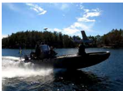
Mobil start med UAV05C från G-båt.

RPAS faller in under samma regelverk och struktur som all militär luftfart. Flygverksamheten leds från RPAS-av-