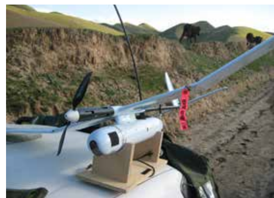
UAV02, ovanpå motorhuven på en TLC i Afghanistan.

SRPAS (Small Remote Piloted Aircraft System) innefattar de mindre systemen som används på stridsteknisk nivå. Den första var UAV02 Falken (Skylark) som tillverkades av israeliska Elbit och började användas av Försvarsmakten 2007. Systemet var en värdefull resurs i insatsen i Afghanistan som snabbt kunde leverera en överblick över den ofta kraftigt kanaliserande och svårtillgängliga terrängen. Systemet hade en räckvidd på ca 10km och en flygtid på 60 min.