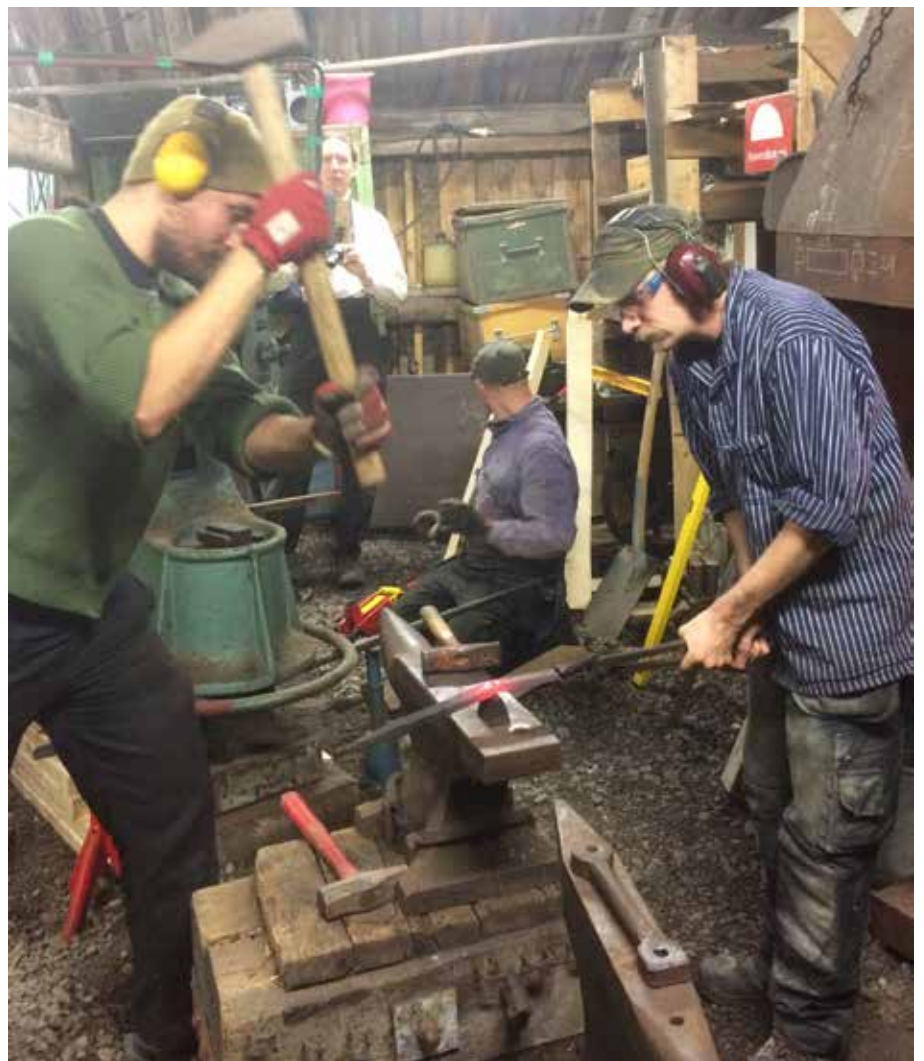
Arbete med kanonerna

Kanonerna har varit saknade så det var med stor förväntan som högvakten såg fram emot att äntligen få tillbaka sina kanoner. Artilleriavdelningen blev väl mottagna och det märktes att arbetet med renoveringen skattades högt.