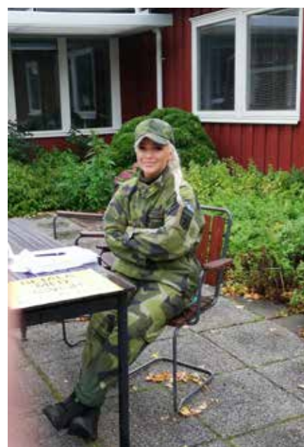
Koll på deltagarna

På bilderna ser vi: Fristadsorkestern, starten. Det marscherande paret