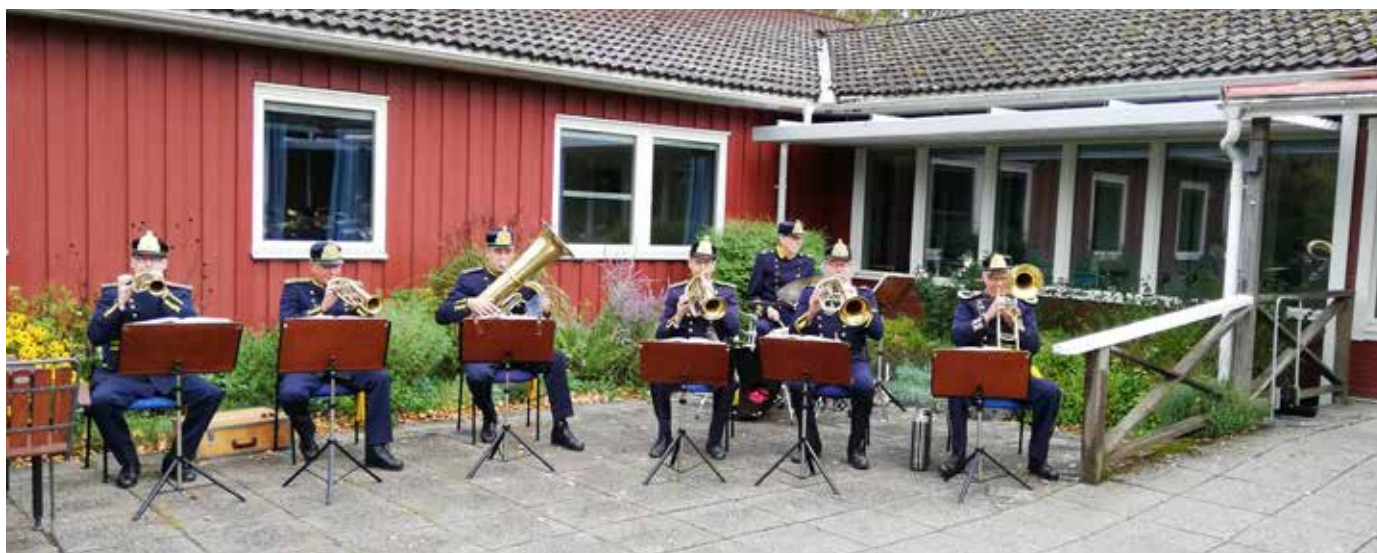
Musik vid starten