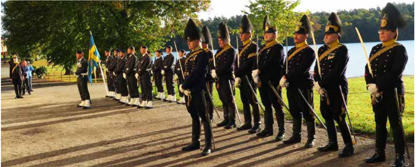
Högvakten och Artilleriavdelningen uppställda för avlämnande till Kommendanten.

ett sågverk i Forsvik, som sågade ek i dessa dimensioner. Vi köpte 1,5 ton ek och när vi skulle lyfta in träet, krävdes det fyra man för att lyfta en plank.