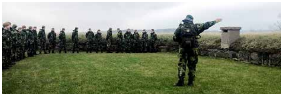
Taktisk terrängorientering guidning

november gick därför stridsbåtar, fullastade med värnpliktiga, i skytteltrafik från sjötransporten ut till Nya Älvsborgsfästning, där guidning och korum genomfördes.