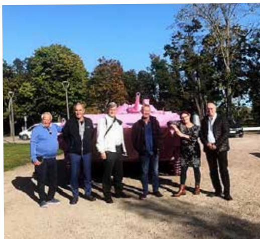
Resegänget vid brigadmuseuret

Vi började med Brigadmuseum som gav oss en förträfflig bild av försvarshistorisk tid efter kriget och kalla kriget. Många minnen från militärtjänstgöringen på 50-talet vad det gäller fordon och annan materiel. Jag stannade till lite extra framför en soldat klädd i den tidens uniformspersedlar. Jag minns speciellt regnskyddet som också kunde tjäna som tält om man kopplade ihop några delar. Befälet påstod även att det var ett bra skydd mot atomvapen. Tvivelaktigt, men ett intressant besök som gav mersmak.