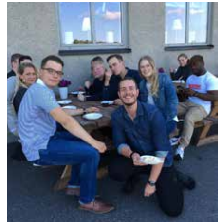
Trevlig fika på soldathemmet