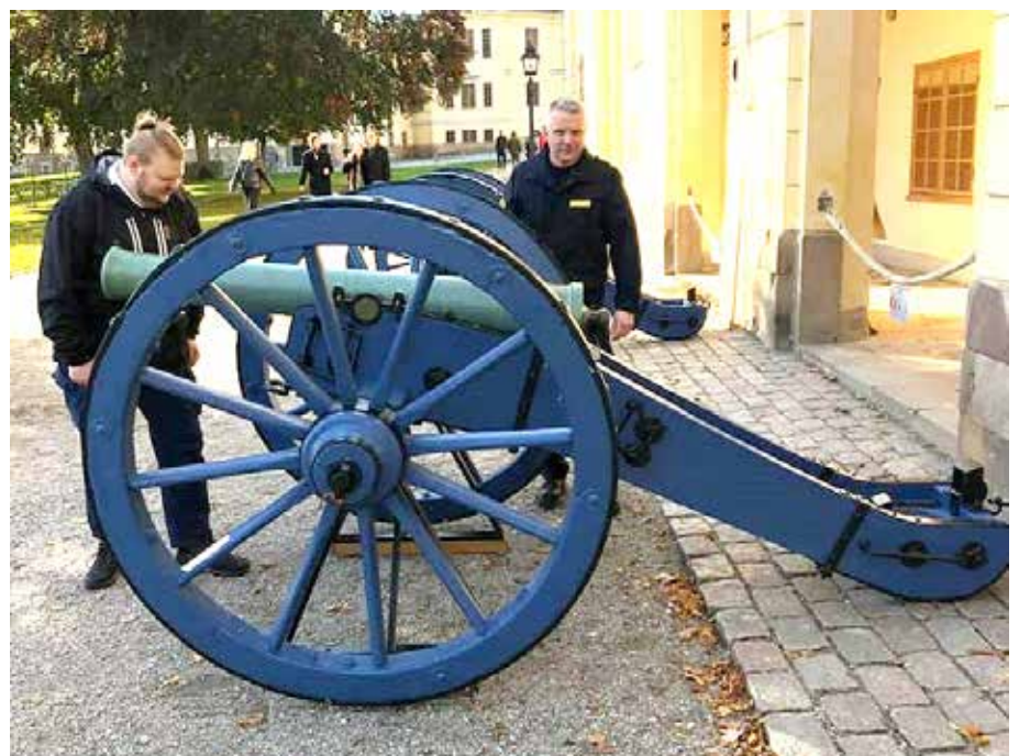
Före och efter