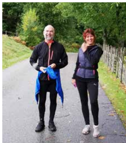
Trevligt att delta