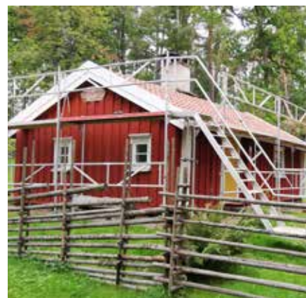
Nytt tak på Laddatorpet