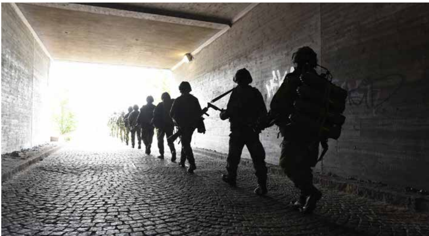
Livkompaniet övar i Stockholm.