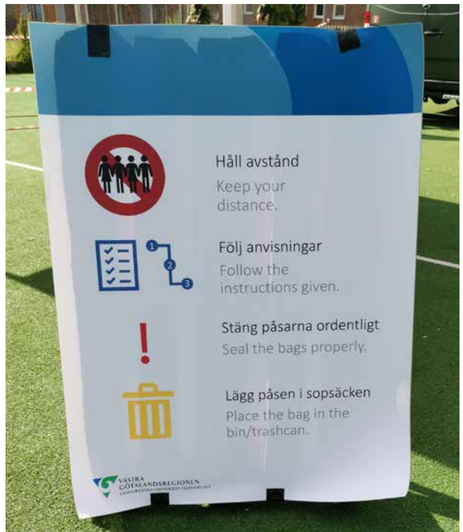
Nedan: Instruktioner för lämnande av prover under Gloria 5