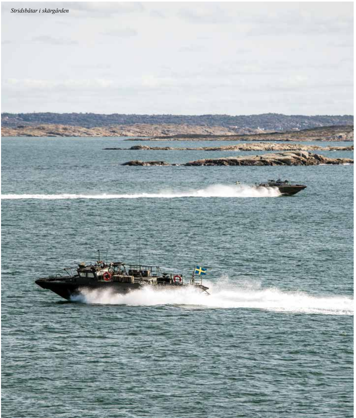
Stridsbåtar i skärgården