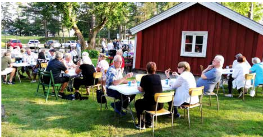
Fika vid torpafton