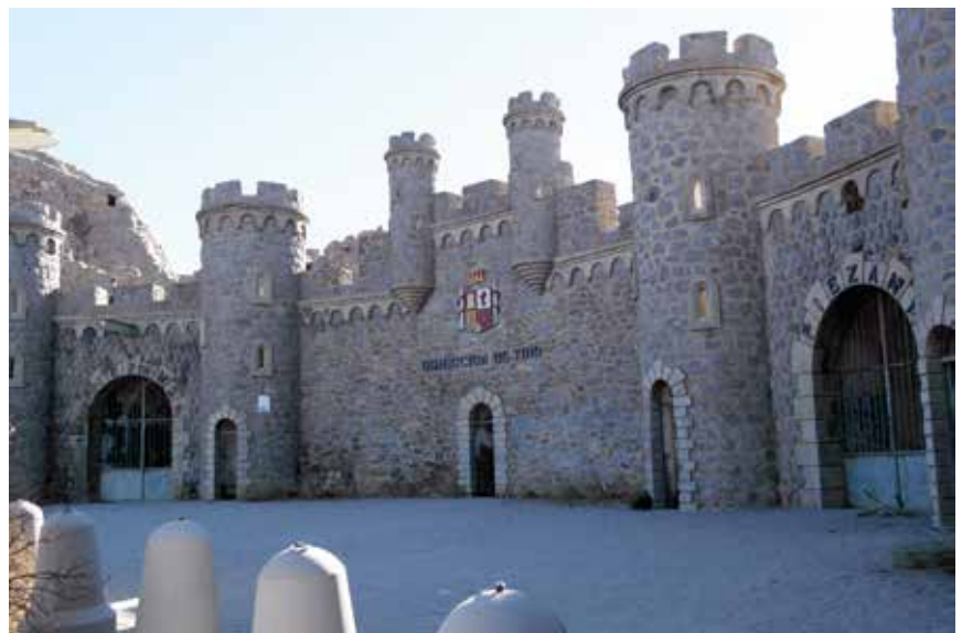
Bateria de Castillitos