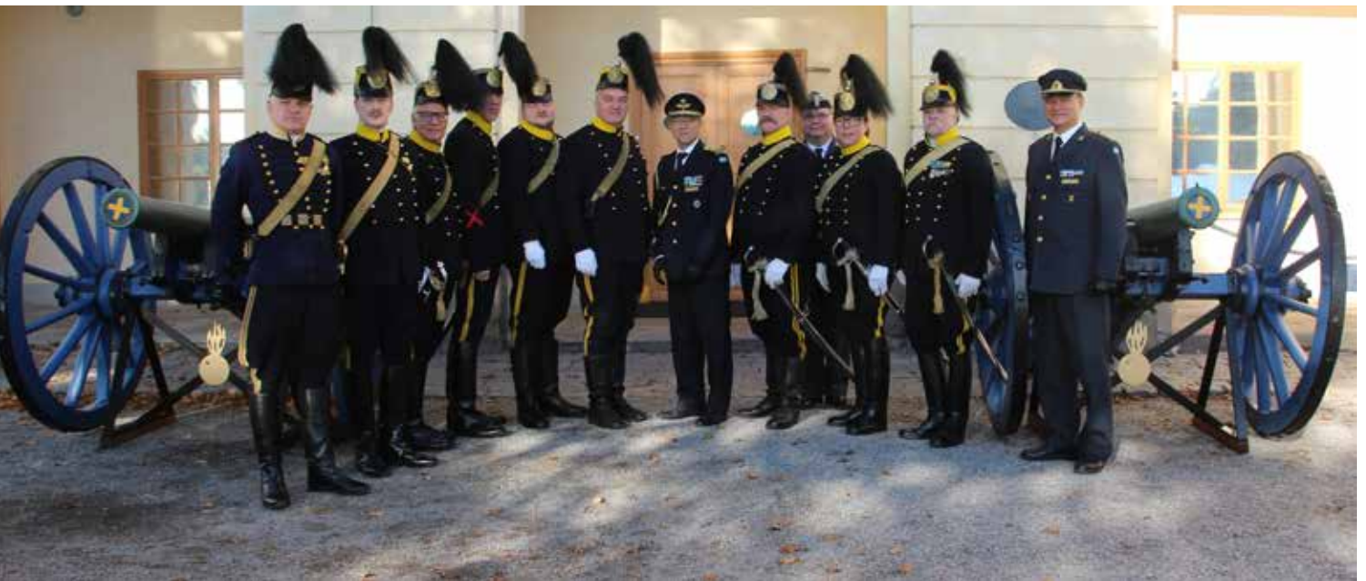
Här står kanonerna på sin plats

tas ihop - inget lim utan det skall hållas ihop med bultarna. Efter en hel del putsande så satt alla delar på plats och på rätt sätt.