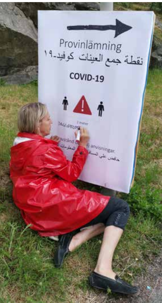
Invisningsskylt till provinlämning. 414

NÄR SEDAN FÖRFRÅGAN för transportomgångar till Gloria 6 och 7 kom så fortsatte vi vårt vinnande koncept och använde våra eminenta soldater. De var nu insatta i vad som skulle göras och