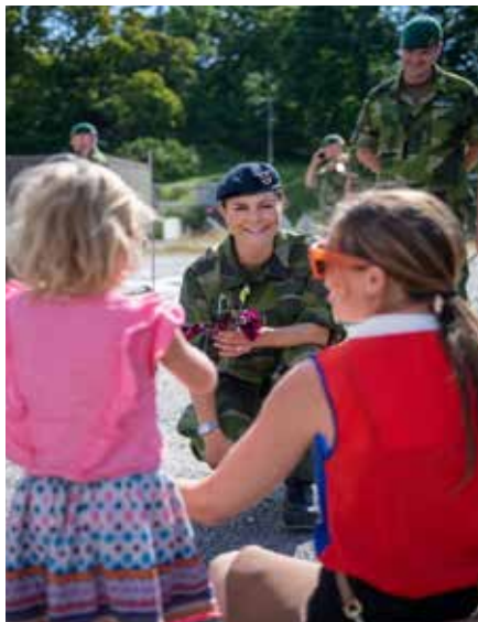
I samtal med stor som liten – vilken succé!

Som avslutning skall jag citera några rader ur kronprinsessans tal som väl passar in på den känsla och inställning vi alla har på "nya-gamla" Älvsborgs amfibieregemente!