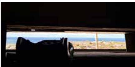
Mätstation inneifrån.