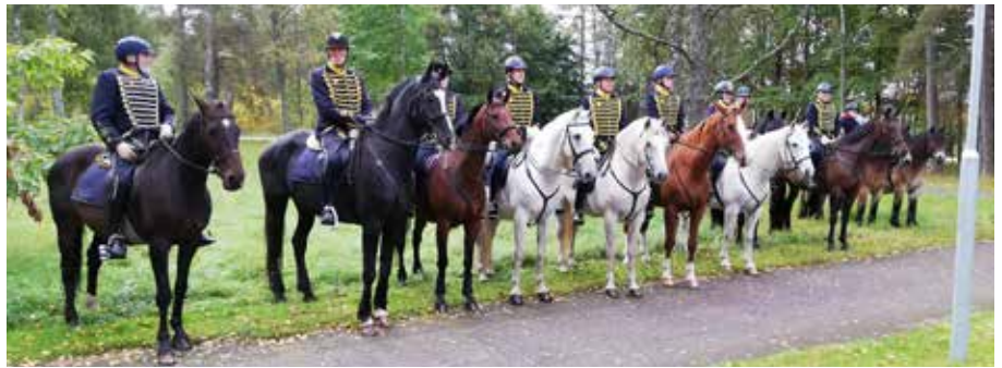
Färdiga för start.

att hedra de soldater som vid regementets flyttning från Fristad hed till Borås år 1914. Denna marsch har vi nu sedan år 2008 anordnat från den gamla till den nya förlägningsplatser, så även i år. Regnet höll sig undan så vädret var idealiskt och de 80 deltagande i marschen var nöjda med sin dag. Som brukligt fanns vätskestation under vägen.