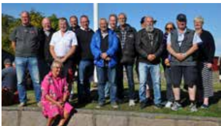
Några av deltagarna.

Efter inryckning och fördelning av logement samt utdelning av sängkläder var det dags för samling utanför RegOff-mässen. Här var baren öppen och solen strålade i kapp med gamla vänner och minnen. C Amf4, Öv. Herlitz, höll ett uppskattat tal och nämnde betydelsen av traditioner och glädjen över att kåren är på tillväxt. Efter tal och lite mingel var det en kort promenad till St. Oset. Där intog vi en god middag och provade att sjunga