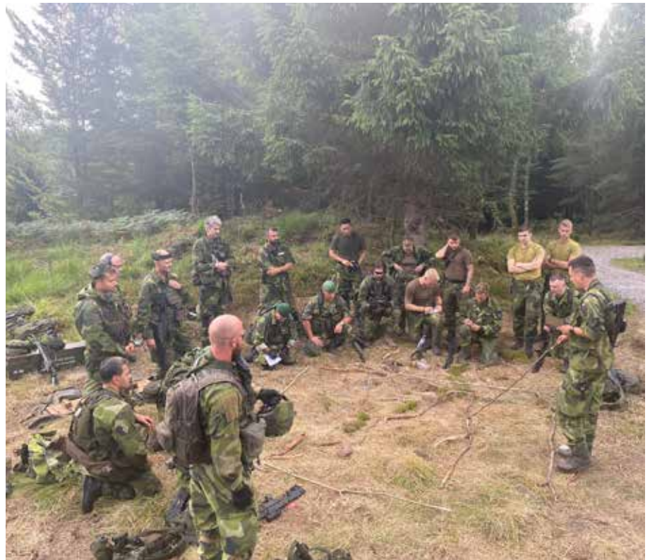
Ordergivning vid utgångsläge för anfall (UFA) med stöd av terrängmodell innan framryckning vid skarpskjutning.

Alla förband vid EBG har genomfört utbildningsåret enligt planerat, trots turbulensen i omvärlden och den påverkan det får på oss alla. Det som har varit kännetecknande är att alla förband, och chefer har fått vänja sig vid att ta ansvar för många nya hemvärnsmän i sina enheter. Vid flera enheter har plutonchefer fått ta ett stort ansvar som utbildare och instruktör utöver sitt ordinarie ansvar att truppföra sin pluton. De har i flera fall växt i respekt och självkänsla av att vara utbildare. Nu har vi siktet inställt på att genomföra 2023, som ett utvecklande år. Det som är den största utmaningen är att vi under perioden april och maj deltar i nästa års storövning, Försvarsmaktsövning 23, även kallad Aurora 23. Övningen är i flera stycken tillämpad, och allt är inte i vår hand ännu, utan fortfarande rörligt. EBG förband deltar med ca 1300 hemvärnsmän under övningen, i hela södra och västra Sverige. Den övriga delen av 2023 är planerad övningsverksamhet för alla förband som inte deltar i FMÖ: n. Därtill så har vi redan börjat att planera på längre sikt, mot 2024, och den kommande övningsverksamheten, inför FMÖ-26.