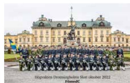
Högvakten Drottningholms Slott oktober 2022 FömedC