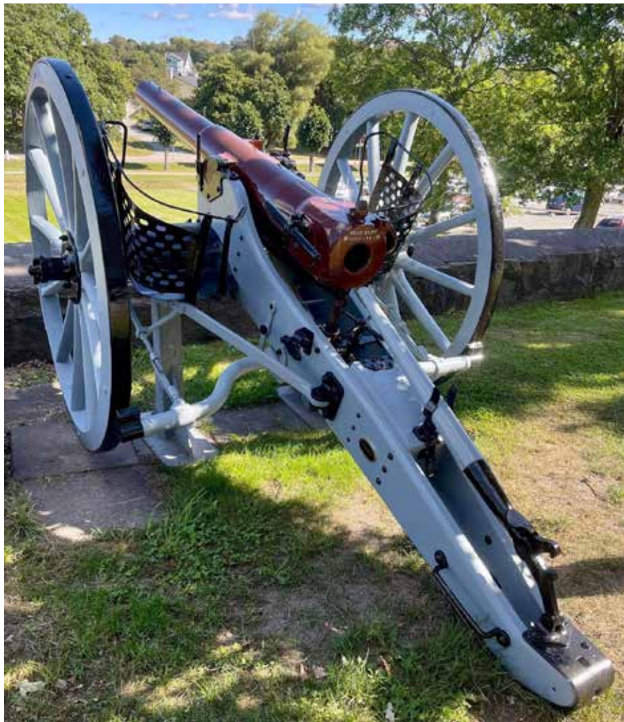
Nyrenoverad kanon på plats framför Stabsbyggnaden Amf 4.

Våren 2021 fick Artilleriavdelningen i Göteborg en förfrågan från Amf4 om vi kunde åta oss att renovera de två kanoner m/1881, som stod utanför byggnad 1 samt utanför mässen.