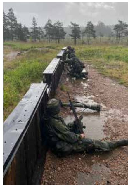
Understöd av sidogrupp från ny stridsställning.

Även i övriga delar av landet har det varit mycket ansökningar till Hemvärnet. Det stora antalet ansökningar är ojämnt fördelat över landet. I de delar av landet där det bor flest människor har det också inkommit flest sök-