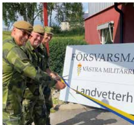
Bandklipping vid vårt nyinvigda förråd, deltagare var Rikshemvärnschefen, C 42. Bat samt C Elfsborgsgruppen.

Den tydliga utvecklingen och utökningen som Försvarsmakten ser framför sig under oöverskådlig tid påverkar alla delar av FM. De nyetablerade, och återskapade förbanden runtom i landet,