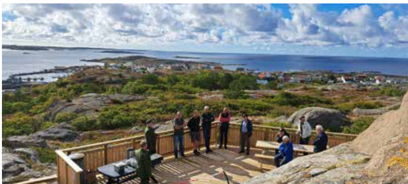
Prima utsikt vid Hyppelns mätstation.