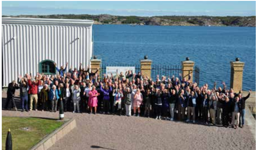
Gruppfoto framför Parloiren på Käsö.

snavsvisor i syfte att kontrollera att alla kunde sin sak inför lördagens middag; repetition är kunskapens moder som alla vet. Efter middagen var baren på RegOff mässen öppen dit många sökte sig innan logementet.