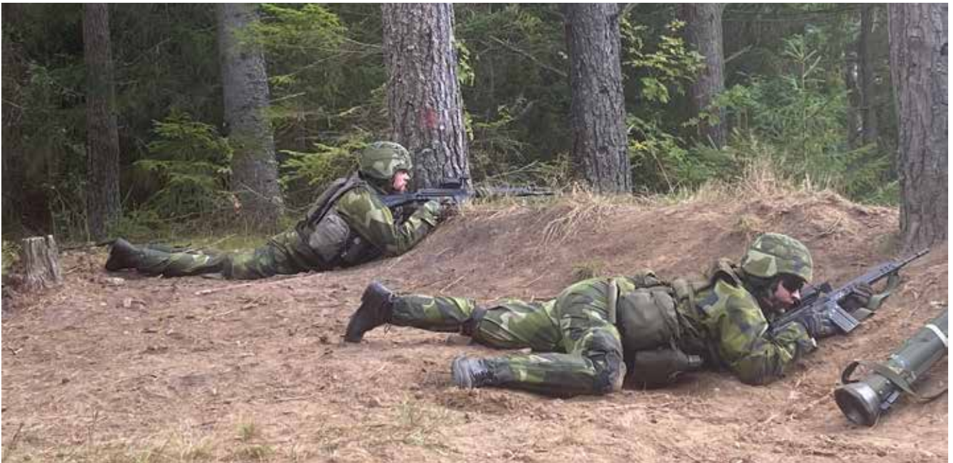
Hemvärnsgrupp genomför försvar av stridsställning. – Observatören observerar, övriga skydd!