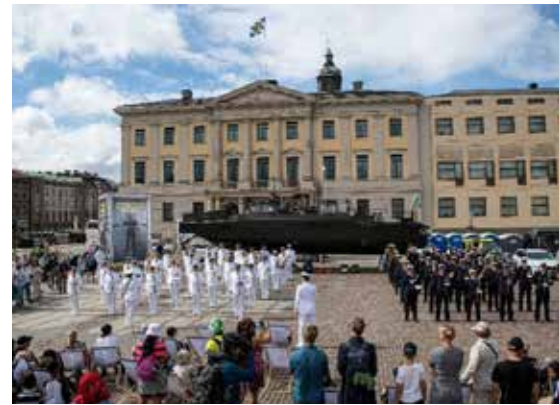
Gustav Adolfs torg.