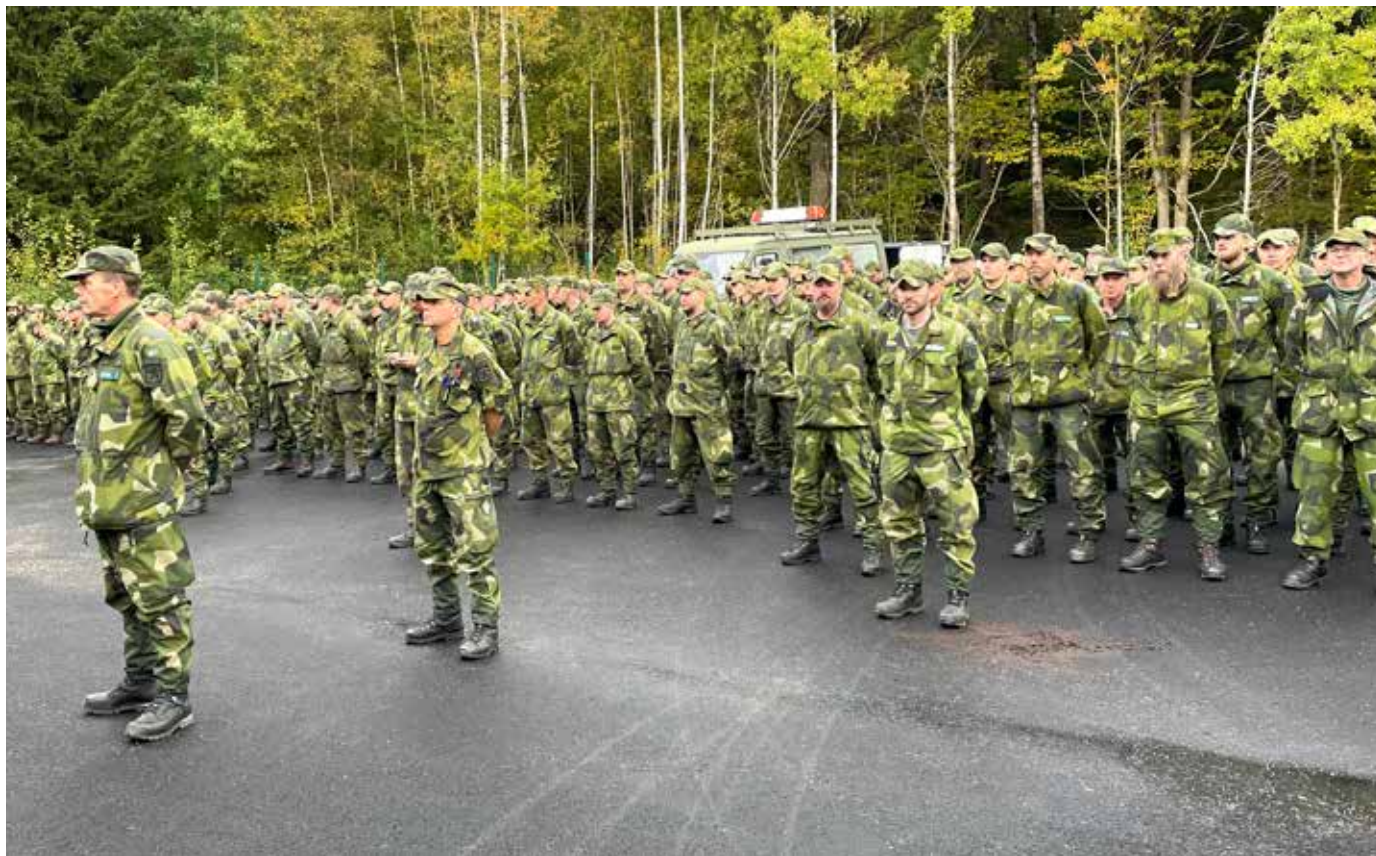
Delar ur 42. Hemvärnsbataljon efter genomförd KFÖ.

Fler än tiotusen har i år ansökt om att bli hemvärnssoldater. I denna målände skildring berättar en av dem om sin resa från ansökan till första krigsförbandsövning (KFÖ).