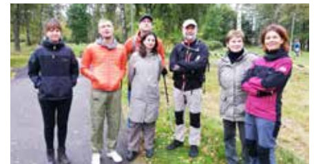
Väntar på start.