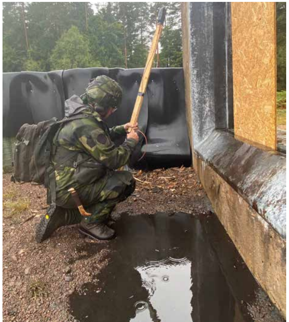
Sprängning av fingerad dörrkarm vid skarp stridsutbildning i byggnad.