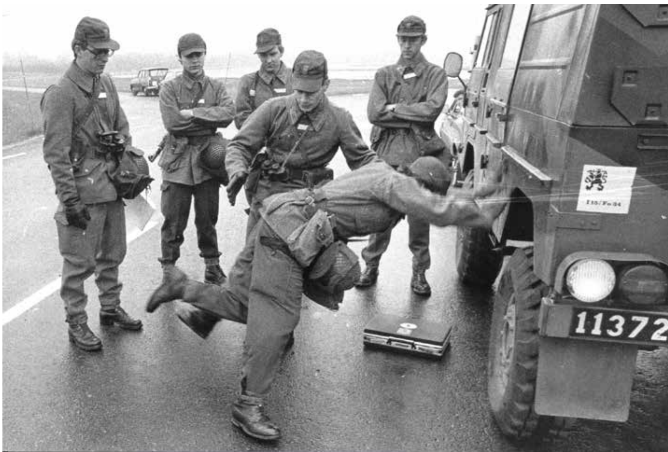
Övning i visitation

Insatsregler, IKFN mm funderade vi på. Övningar i visitation och omhändertagande av fångar mm genomförde vi med soldaterna under tiden som Blågul försökte övertyga Högkvarteret att vi var klara att sättas in i Karlskrona. Vi var spända men sugna på att sättas in och visa vad vi gick för.