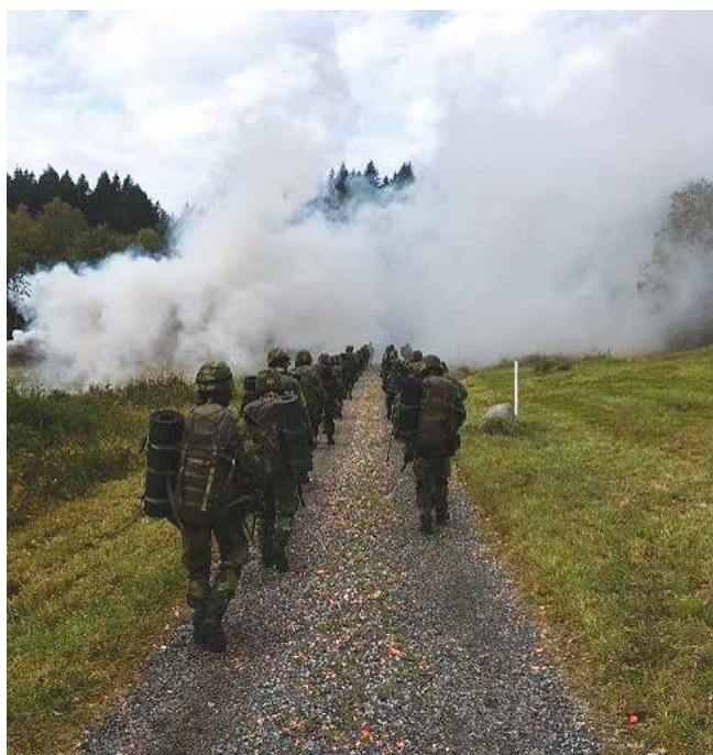
I rök och damm gick en svensk soldat