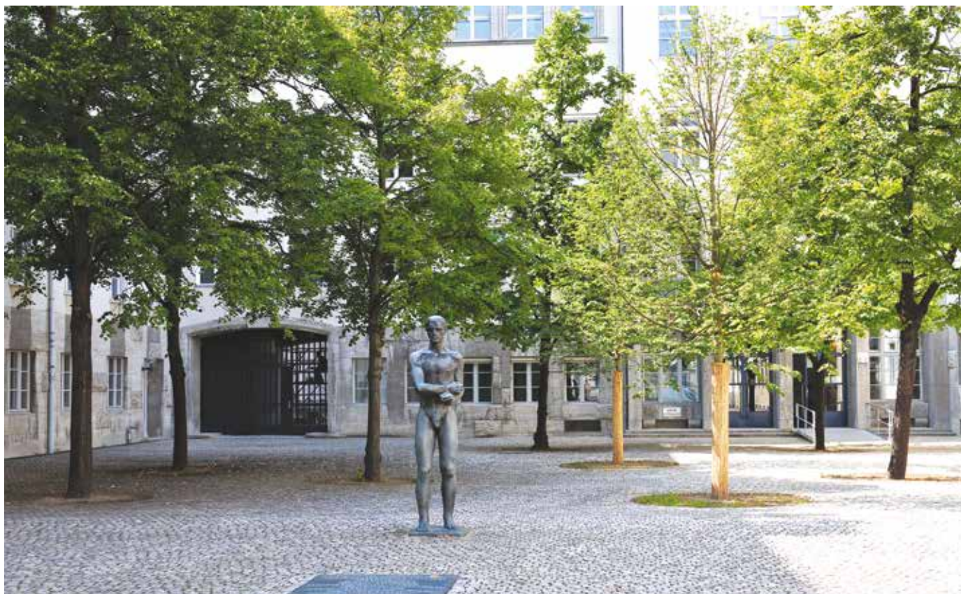
Platsen för arkebuseringen

runt om i landet, varav det enligt uppgift finns dokumentation på att 4 980 av dem blir avrättade. En del av dem genom hängning i strypsnavor av pianotråd och där avrättningarna filmades och sändes till Adolf Hitler.