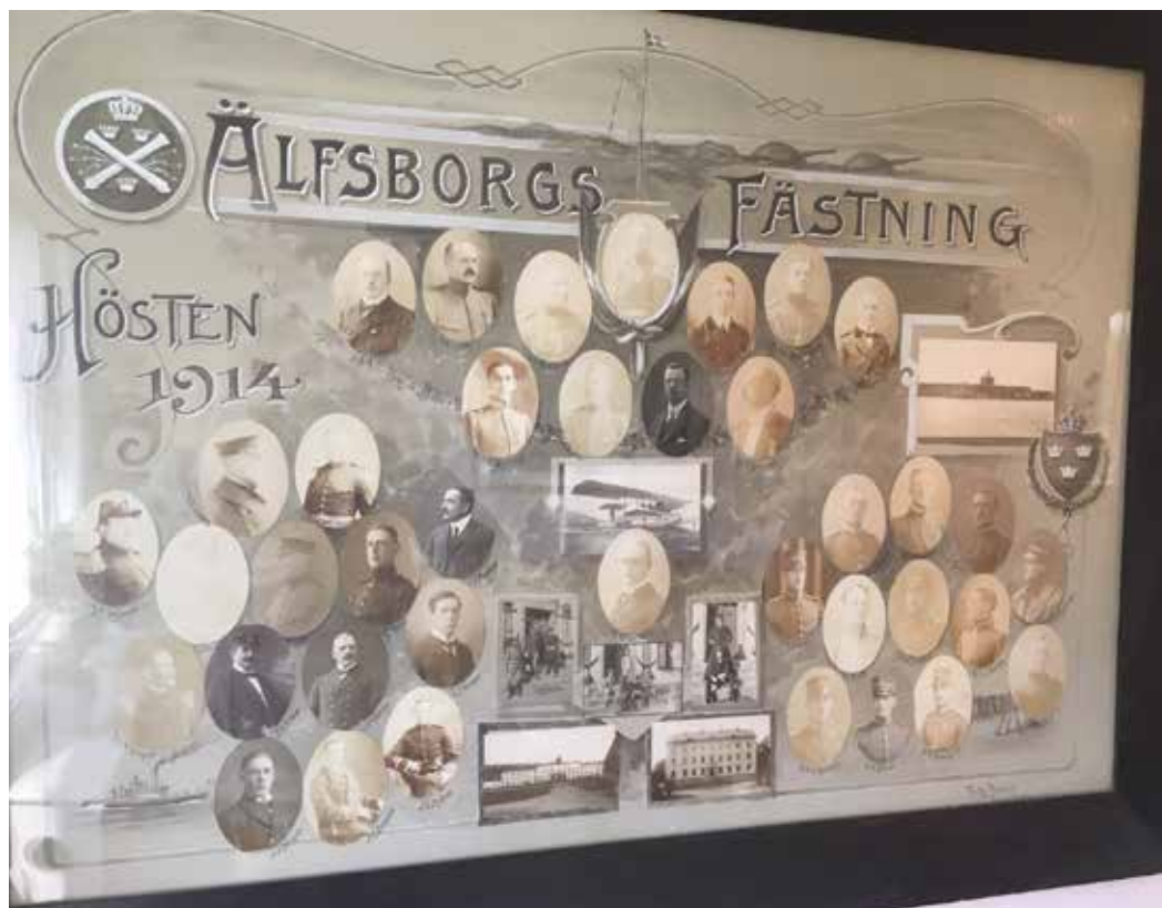
"Minns din historia, lär av den".