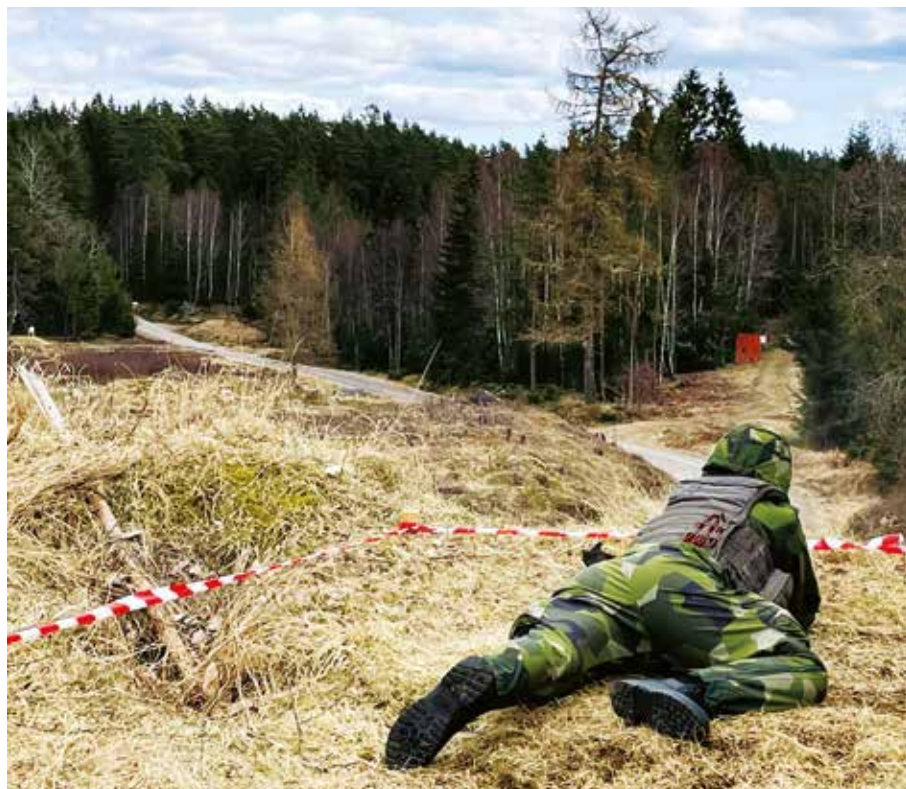
Avdelningsmästerskap1.