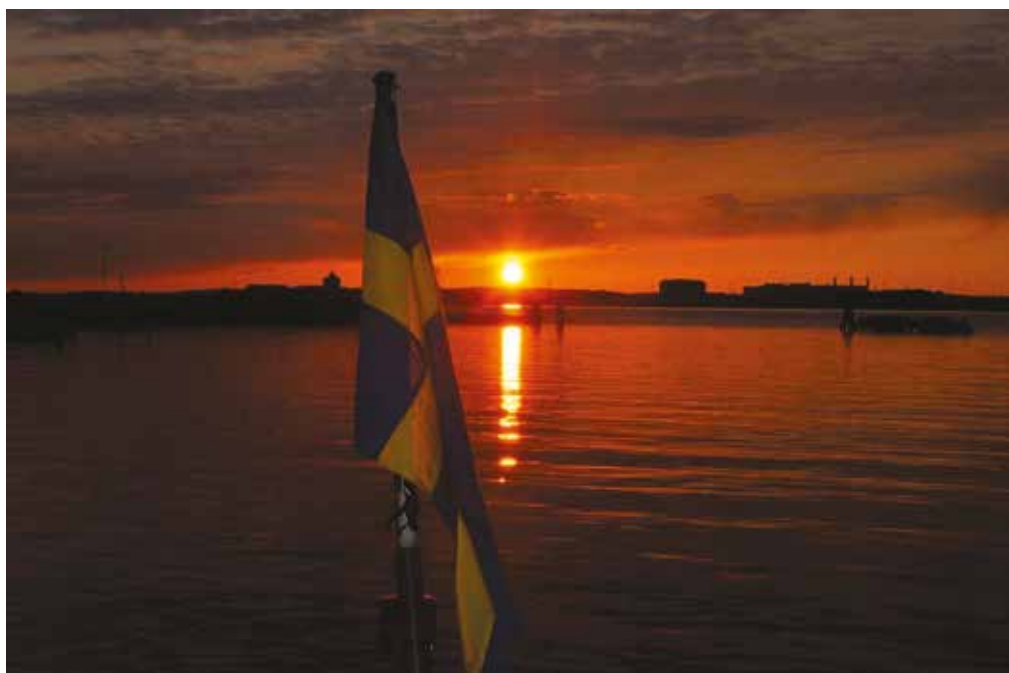
Stämningsbild över Göteborgshamn.