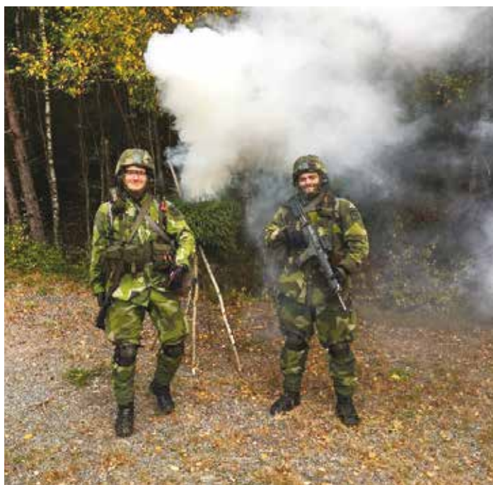
Bodin med kamrat.