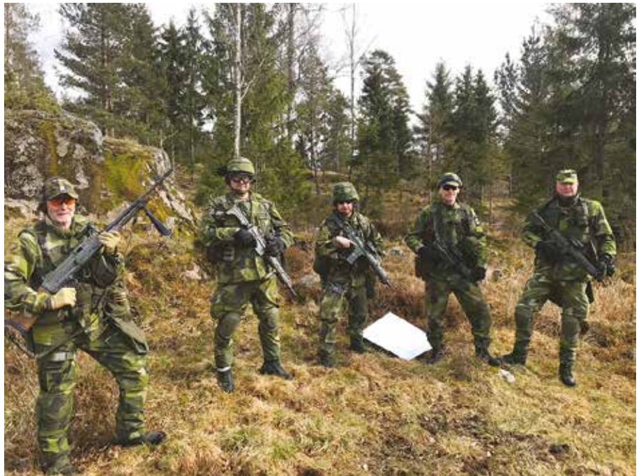
Utbildningsofficerare vid EBG vid befälsutbildning i strid.

Hemvärnet i Göteborgsområdet har sedan länge varit en naturlig del av den ceremoniella verksamheten i Göteborg. Den rollen har blivit tydligare desto färre förband som har varit tillgängliga på västkusten. Från att tidigare ha deltagit i fanvakter vid olika högtider, så har Hemvärnets deltagande ökat. Nu ansvarar EBG för bemanning av salutstyrka för stadens salutbatteri vid officiella nationella högtider, samt vid flottbesök i Göteborgs hamn. Salutbatteriet i Göteborg där EBG salutstyrka genomför salutskjutningar på uppdrag av HKV är grupperad vid Skansen Lejonet, vid Gullberg gamla skans, nära Svingeln och Centralstatio-