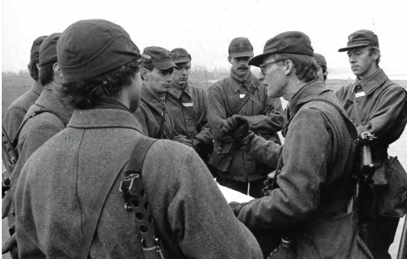
Kompaniledningen diskuterar eventuell uppgift.

Medan vi väntade på besked så ledde kompanichefen diskussioner runt vad en eventuell insats skulle innebära.