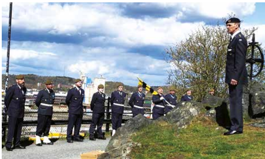
EBG deltagande personal i pjäsbesättningarna ur salutstyrkan vid H M Konungens födelsedag.

starten. Några ur pjäsbesättningarna har varit med hela vägen, frivilligt, och utan ersättning, en fantastisk gärning, med stort engagemang.