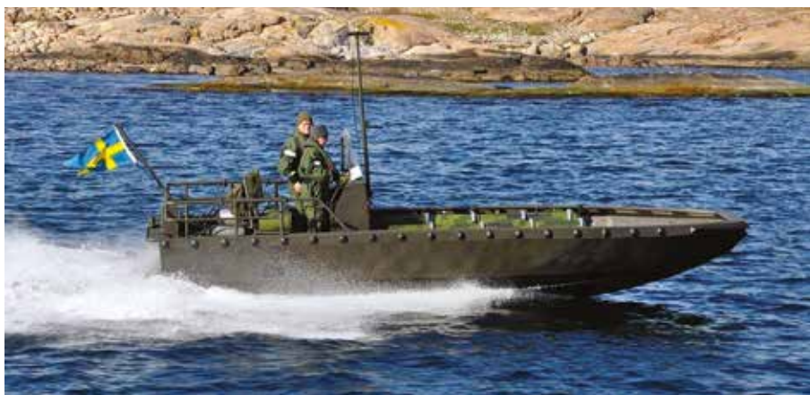
Personal ur Elfsborgsgruppen under framfart Foto Carl Kjellberg.

Arbetet i frånvaro av de stora övningarna med KFÖ och SÖF av våra bataljoner har tätt sig annorlunda för utbildningssektionen, fortfarande under tydlig ledning av Mj Niklas Trygg. En del har varit att prioritera att uppdatera kompetenser hos egen personal, och ett antal gränssättande förmågor hos EBG och förbandens personal. Med gränssättande verksamhet innefattas utbildningar som måste genomföras för att kunna upprätthålla våra förbands beredskap, och för att vidmakthålla