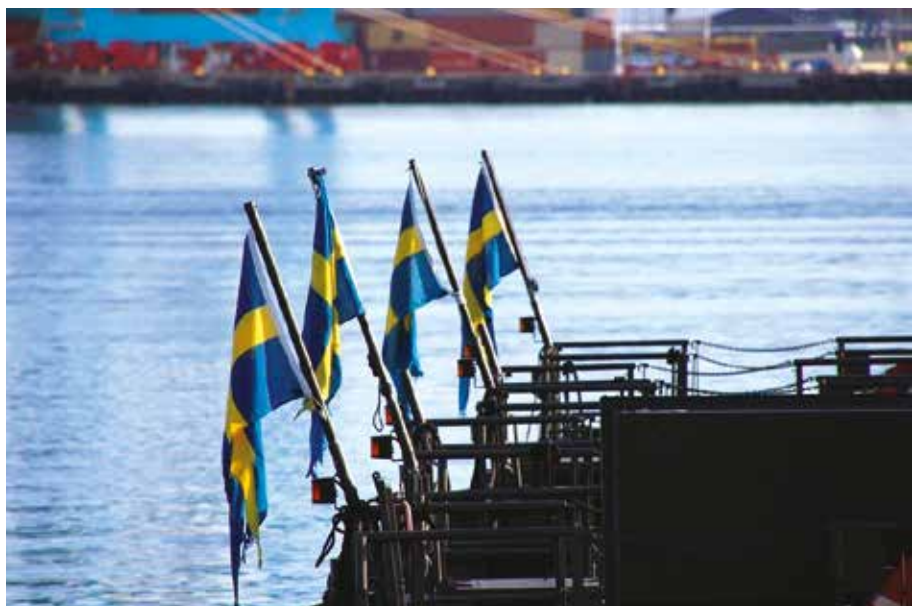
Tidig morgon i örlogshamnen Göteborg.

Den första salutskjutningen helt i EBG regi genomfördes vid H M Konungens födelsedag, 30 april 2006, alltså på Valborgsmässoafton. Då fyllde H M Konungen 60 år. Nu har EBG ansvarat för detta i femton år, och när vi firade H M Konungens 75-årsdag den 30 april i år, så sköt EBG salut nr 100 sedan