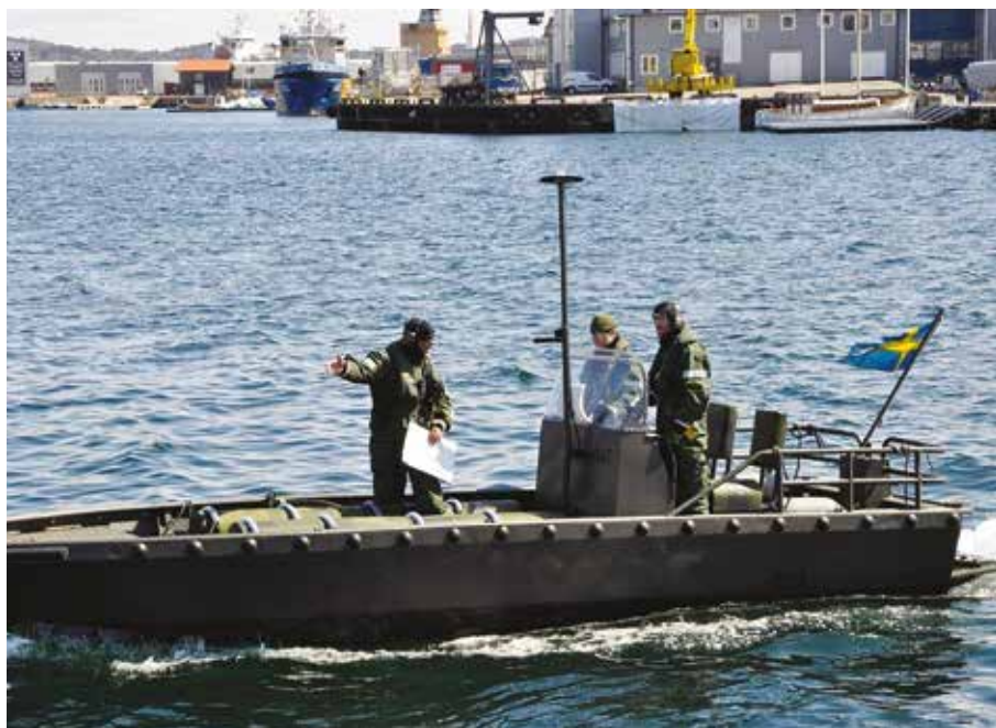
Instruktör visar vägval för fortsatt färd

riskerar att bli angripen kan man anta att angriparen vill göra en militärstrategisk nettovinst genom att i så liten utsträckning som möjligt förstöra infrastrukturen, men däremot ta kontrollen över den.