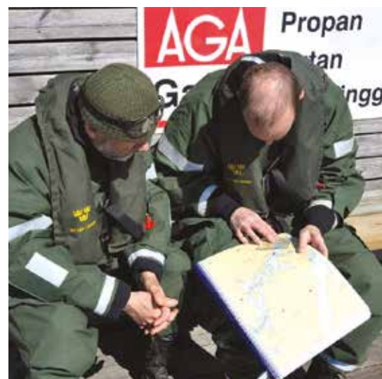
Planläggning av fortsatt färd vid bunkring i Lysekil.