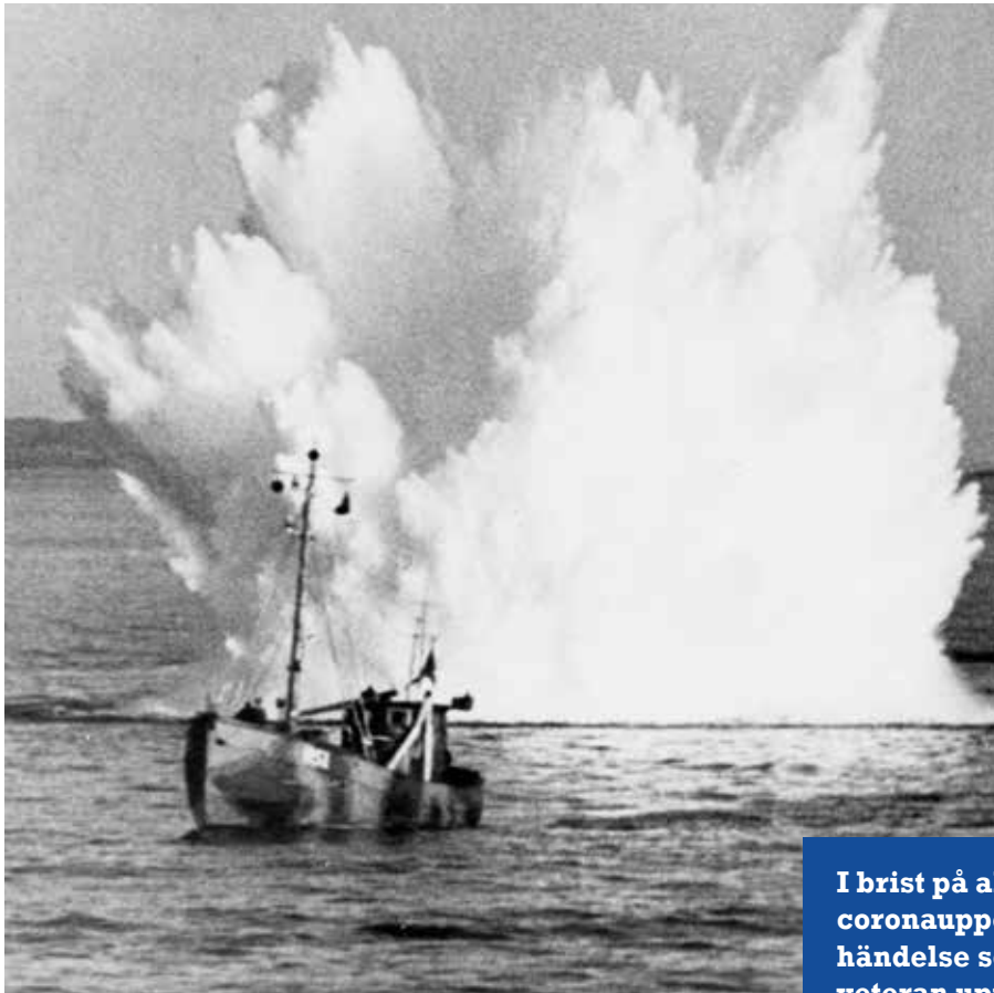
Minsprängning. Okänd fotograf, Marinmuseum