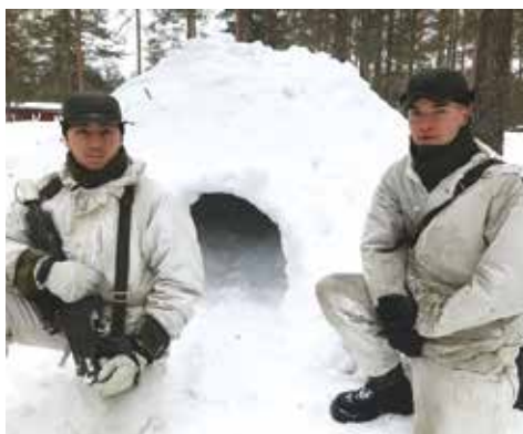
Iglo för övernattnig.