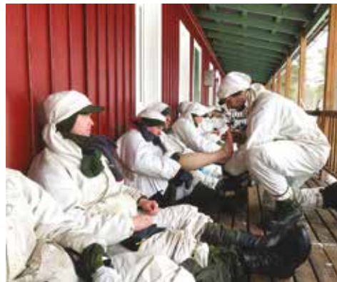
Behöver se till fötterna även vid skidåkning.