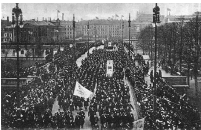
1914 marscherade 30.000 personer för starkare försvar