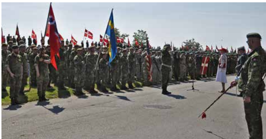
Danmarks drottning inspekterar den mäktiga truppen på nationaldagen

En jämförelse mellan danskt och svenskt Hemvärn visar att vi har liknande befogenheter vid skyddsobjekt