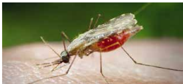
En malariamygga i aktion