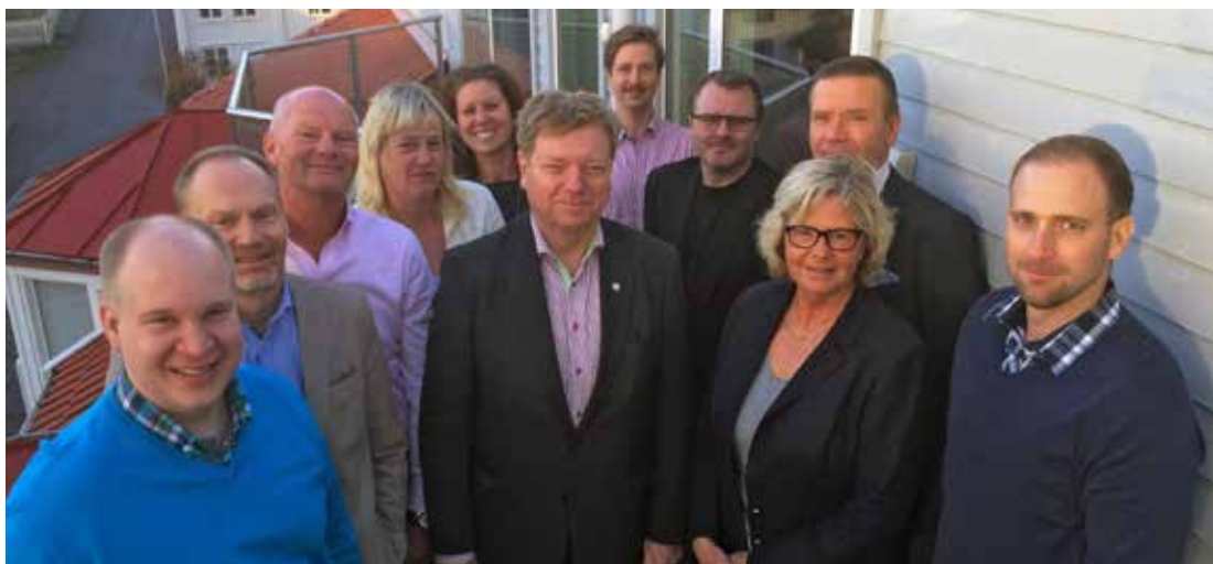
Beredskapsgruppen på konferens