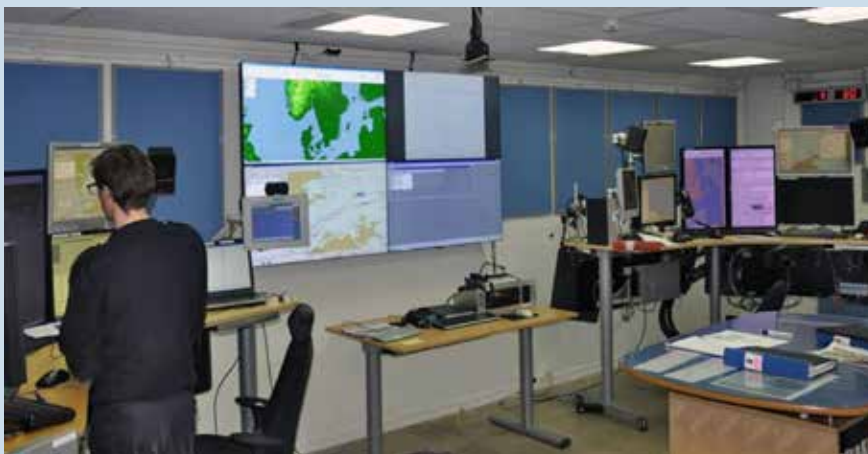
Vy från Sjöinfocentralen på Kåringberget

Under slutet av 1980-talet byttes det föråldrade datorstödda presentationssystemet STINA (Sjö Tull INformations Anläggning) ut mot ny PC-teknik och systemet STRIMA (STRidsledningssystem för MARinen) vilket innebar att arbetet inte längre behövde bedrivas i mörker p.g.a. ljussvaga skärmar. 2009 infördes