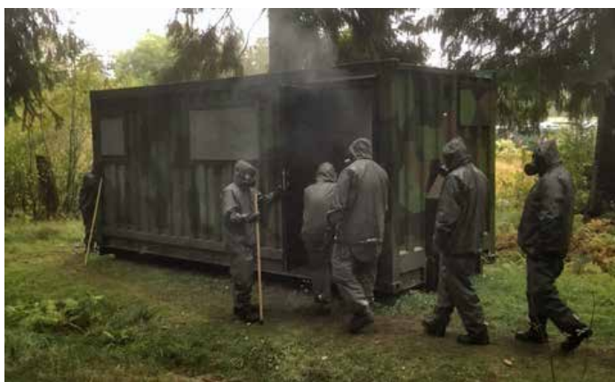
Tillpassningskontroll av skyddsmask

Efter genomförd mobilisering under torsdagen övade plutonen på ordregivning (marschorder) och efterföljande fordonsmarsch på fredagen. Vid destinationen Brudareossen gjorde plutonen halt vid en "FAP" och ledningsgruppen fortsatte med rekognosering av området vid Brudareossen.