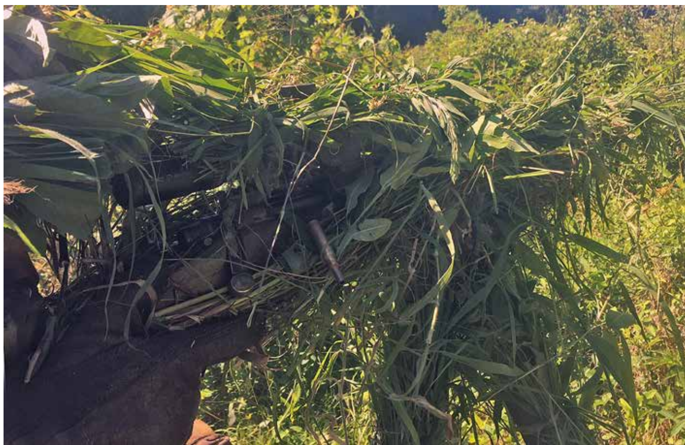
Kraftigt kamouflerad skytt under stalmomentet

Mellan april och juli deltog ett par prickskyttar från Marinens del av 13. Säkerhetsbataljonen: Säkerhetskompani Sjö i Marinkårens grundläggande prickskytteutbildning – Marine Scout Sniper Course. Kursen gick av stapeln på Marinkårsbasen i Quantico, Virginia och eleverna kom från olika delar av Marinkåren, samt i detta fall, elever från Sverige och 1. Amfibieregementet.