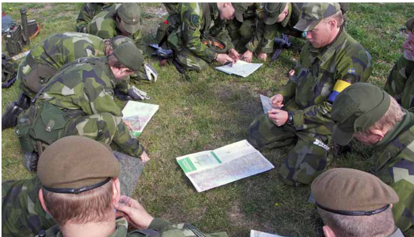
Undervisning på Känsö

En stor del av vår dagliga verksamhet gick till vår befattningsutbildning, men utöver den schemalagda utbildningen fanns ett annat utbildningssyfte med denna period – enligt vår plutonchef. Från den hårt reglerade kommandostyrningen skulle vi vänja oss vid uppdrags-taktik. Vi skulle med andra ord bli vuxna, tänkande, ansvarstagande individer igen