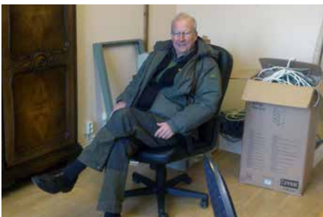
Jan pustar ut i röran efter hedervärt arbete

Nu disponerar vi två våningar i det vackra Kanslihuset på det nedlagda regementsområdet. Runt den gamla kaserngården finns ännu tre kaserner, en matsal, en gymnastiksal och centralt tronar vårt gamla Kanslihus. Visserligen finns inga soldater kvar, inga "Giv-