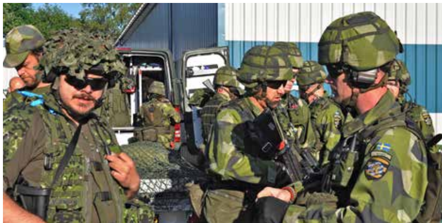
Danska och svenska hemvärnssoldater samövade

I början på juni deltog Elfsborgsgruppen med ett hemvärnskompani (441. komp) från Borås i den danska övningen "Landsøvelse16". Ett stort antal andra nationer deltog, även dessa med trupp ur Hv-förband.