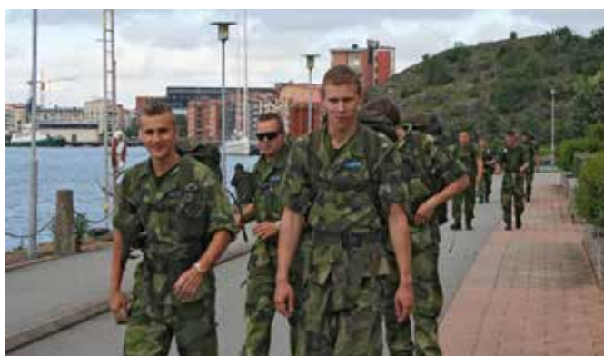
Några entusiastiska deltagare 2015 vid Norra Älvstranden