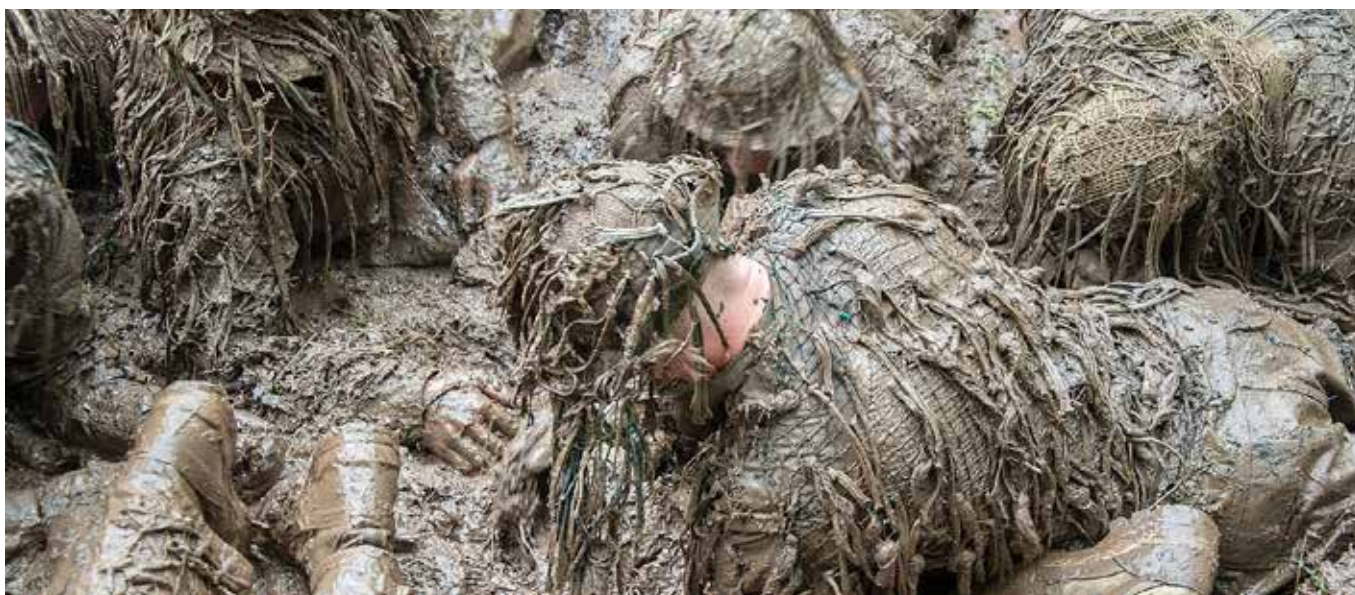
Kamouflagedräkterna testas och ges en naturlig maskering

Tiden i USA har gett eleverna och förbandet en fördjupad förståelse för