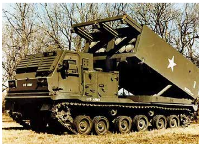
MLRS, ett raketsystem med egen bandvagn. En avancerat artillerienhet med en räckvidd på 160 km – i vissa fall ännu längre. 700.000 raketer har tillverkats.

1,1% av BNP måste bli 2% Blir inte anpassningen av försvarsförmågan dyrt? Jo, det kommer att bli kostsamt. Vi dras med en underlåtenhetsskuld. Anpassningen har redan sinkats i tio år. Hålen är stora. Alla går givetvis inte att täppa till snabbt, men framför allt materiellmässigt kan tveklöst en hel del åtgärdas utan ytterligare långa utredningar. Nu krävs både omedelbara och långsiktiga åtgärder jämsides med varandra.