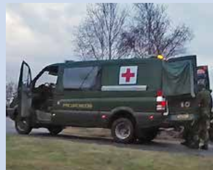
Ambulansen är en ombyggd PB8