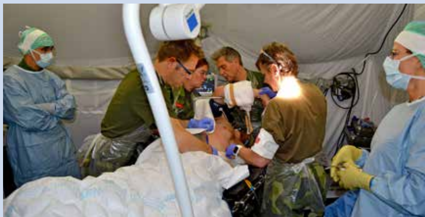
I EEC förbereds en skottskadad inför operation