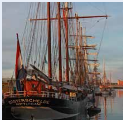
En vacker fullriggare från Holland

Tältet där utställningspersonalen skulle äta låg alldeles intill kokplatsen, så det var inga problem med leveranserna av färdig mat till serveringen. Under lördag o söndag hade vi förstärkning av två ordinarie Hv-kokgrupper och det var ju bra att det fanns avlösning. Varje dag serverades frukost (för vaktstyrkan), kaffe o fralla kl 09.00,