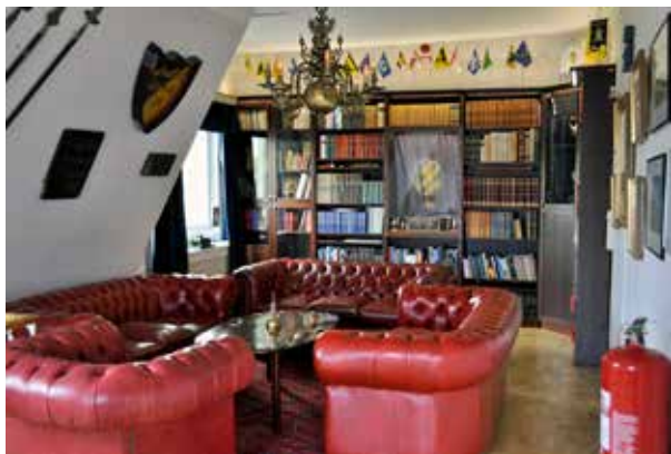
Vårt trivsamma bibliotek på Älvsborgsmässen