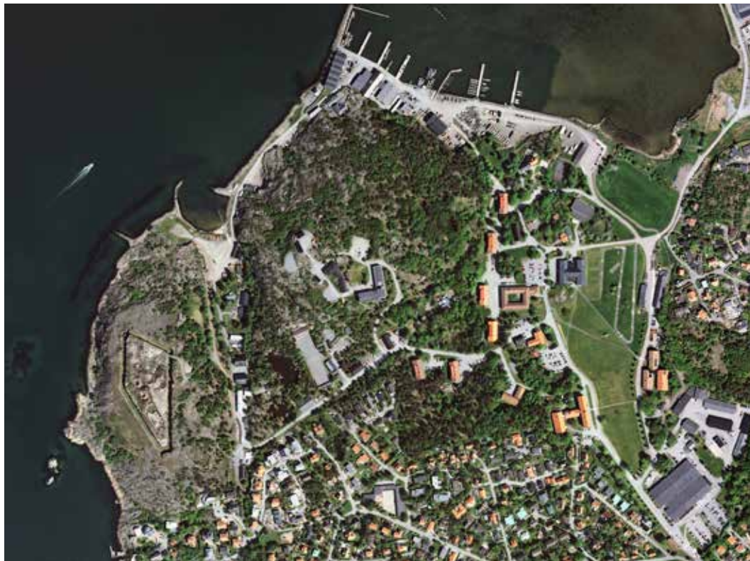
Käringsberget sett med Eniros ögon

Från slutet av 40-talet till 1994 var läget vid försvarsmaktens förband i mångt och mycket statiskt. En plats, en verksamhet, en chef. Vid periodens slut hade Järnridån rämnat och försvarsmaktens förband upphörde att vara egna myndigheter. Intill 1994 var det regeringen som utsåg förbandschefer och dessas mandat kan jämföras med länspolischefernas innan polisen blev en myndighet i januari 2015. Försvarsmaktens övergång till en myndighet sammanföll med att politikerna såg en möjlighet att omfördela delar av försvarsbudgeten till andra utgiftsposter – ”Peace dividend”, var en slogan i början av 1990-talet.