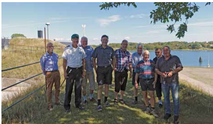
Karlskrona bjöd på sitt bästa väder vid träffen i augusti

Under senare år har vi sett att antalet medlemmar i vår kamratförening tyvärr minskat alltmer. När man är