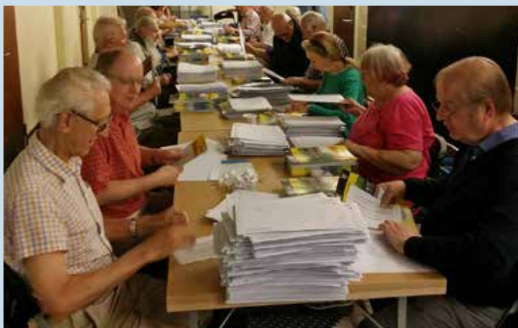
Flitiga damer och herrar med viktigt uppdrag

Orsaken till att Älvsborgarna distribueras i kuvert är att berörda chefer/organisationer skall kunna skicka med riktad information. Huruvida denna möjlighet utnyttjas är upp till respektive chef/organisation. Man kan paketera ner till gruppnivå om så önskas. Detta är en bra möjlighet att till en låg kostnad två gånger om året nå specifika mottagare.