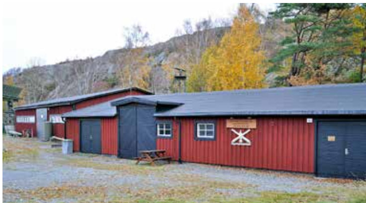
I Fortbacken vårdas nu våra traditioner

För att skapa en uppfattning om Traditionsrummets boksamling påbörjades för några år sedan ett arbete att registrera boksamlingen i en databas. Det hade tidigare påbörjats några försök, men dessa slutfördes ej. Databasen skall också medge sökningar, vara ett verktyg för att gallra ut dubletter, hitta på vilken hylla boken står samt olika former av presentationer.