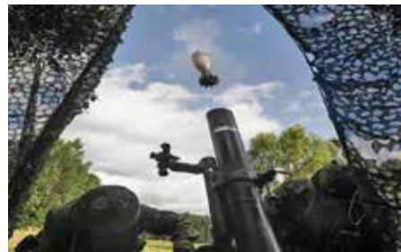
12 cm granatkastare m/41 kan bekämpa mål upp till 7 km bort

Efter antagningsprocessen är planen att plutonen genomför en repetitionsutbildning under kvartal 3 2017 (veckorna 34-36). Därefter genomför plutonen under 2018 Särskild övning förband (SÖ) och Krigsförbandsövning (KFÖ) med mycket skarpskjutningar i syfte att bli säkerhetsgodkänd och operativ till