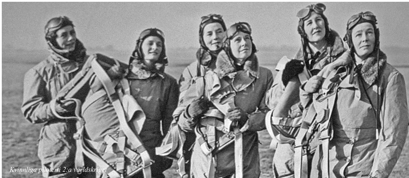
Kvinnliga piloter i 2:a världskriget