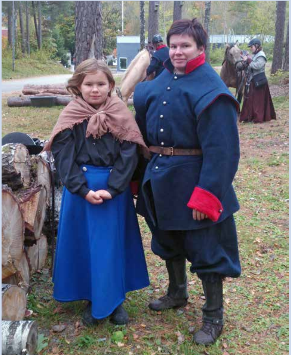
Deltagare ur Karolinerryttarna

Marschen går utmed Öresjöns vackra strand och fortsätter uppe på Ryda Åsar, vidare genom Ramnaparken till målet inne på gamla regementsområdet