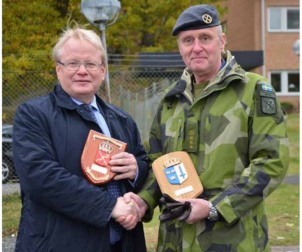
Försvarsminister Peter Hultqvist besökte Garnisonen i oktober. Han fick en grundlig genomgång av verksamheten och verkade mycket nöjd.

Då har tiden kommit att summera ytterligare en hektisk period. Som vanligt tänkte jag ta tillfället i akt att se tillbaka på det gångna halvåret och även förmedla några tankar om framtida verksamhet.