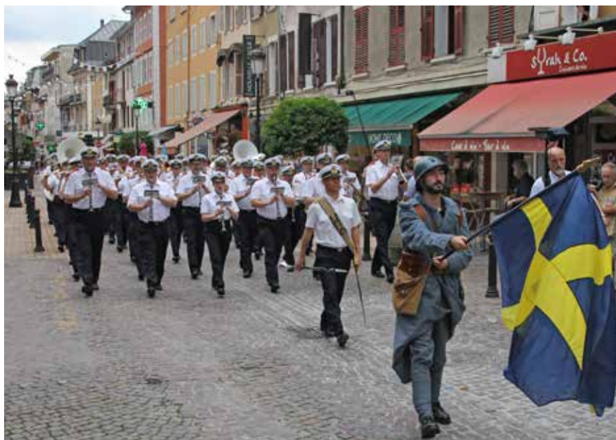
Albertville är känt från vinterolympiaden 1992.

Arrangörer av internationella musikfestivaler strävar oftast efter att bjuda in musikkårer från olika delar av världen och med olika inriktningar. Göteborgskåren var den enda nordiska orkestern, de övriga musikkårerna kom från Ryssland, Österrike, Italien, Ukraina och Frankrike. Musikstilarna var naturligtvis olika, men såväl publiken som arrangören uppskattade den svenska modellen och den svenska musiken.