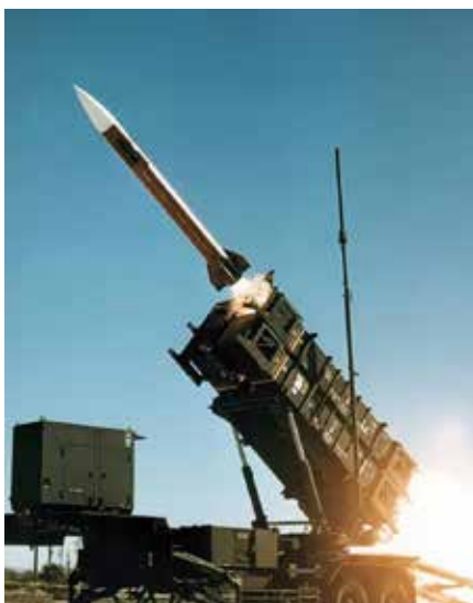
Patriot, tillverkas av Raytheon, har lång räckvidd och egen radar för målsökning. Kan monteras på fordon och fartyg. Används mot flygmål och andra robotar. Förekommer i ett flertal länder.

• Det finns inget utrymme för att i närtid slakta effektiva flygplan, för att få delar till flygplan som kan ge effekt först