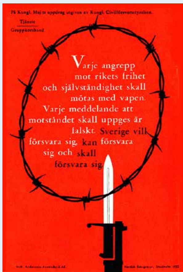
Skriften "Om kriget kommer" gavs ut 1943-87