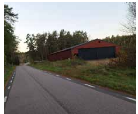
I B 15 2bataljons granatkastarkompani mobiliseringsförråd.jpg