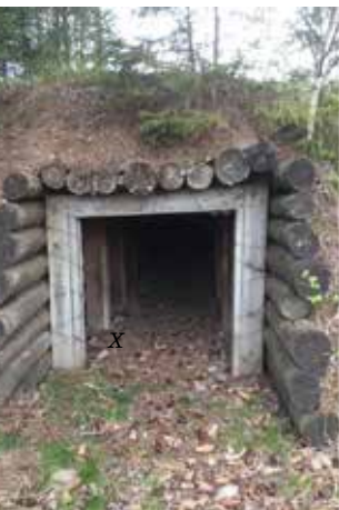
SK16 vörn vid Kranhults bro