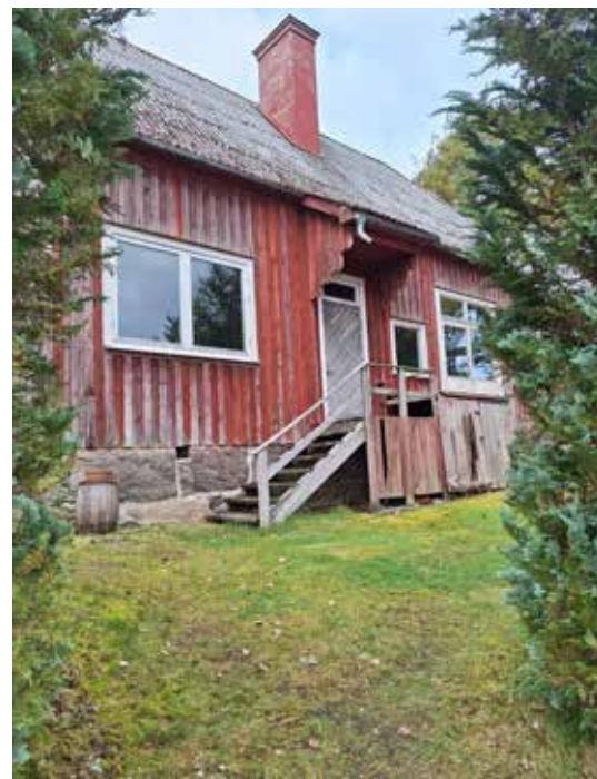
Spioncentralen med täckmantel konservator arbete

I villan i Köpmannebro hade M-gruppen en framskjuten ledningsplats under några år. Där skedde också en rad viktiga möten mellan ledande personer i den norska motståndsrörelsen och den norska legationen i Stockholm. En förgrundsgestalt i motståndsarbetet i Oslo-området och Östfold var Gunnar Thurmann Sönstebye, bla med täcknamn Kjakan och nr 24. Han arbetade bla i ett nätverk med namnet Oslogjengen och senare i