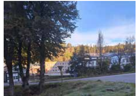
Här i fabriken i Viskafors var bataljonens personaltransportkärror mmm förrådsställda

Vi hade i huvudsak vår materiel. Soldaterna hade vi själva utbildat och visste vad de kunde. Vi var stolta över vad vi kunde och säkra på att vi skulle kunna lösa våra uppgifter.