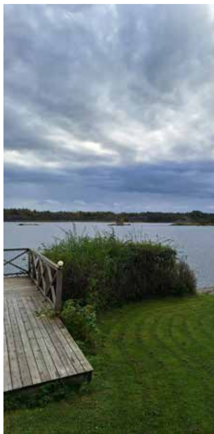
Över denna vik roddes man från stationen i Köpmannebro till spioncentralen