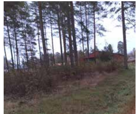
Skogen bakom mobiliseringsförrådet där kompaniets personal skulle förläggas under mobiliseringskedet