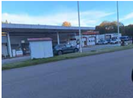
Detta var för IB 15 Avlämningsplats för fordon så kallad APL. Där uttagna fordon väderades och inlöstes

hämtas fanns beskrivet i den mobpärm som fanns i kassunen i förrådet och en kopia i Kanslihuset tillsammans med nycklar till mobförrådet och en uppsättning fanns vid mobförrådsgruppen som såg till att materielen i förrådet kontrollerades och hölls aktuell och i ordning. Då vi genomförde mobiliseringsövningar deltog en förrådsman som var ansvarig för förrådet och gick igenom hur läget var i förrådet med cheferna. Vid regementet var det alltid god ordning i förråden och de var väl uppfyllda. Den oftast stolte förråds mannen gick igenom listorna med förbandschefen och kunde berätta att du saknar 4 radioapparater i förrådet. De är på grundkontroll. Saneringsmedel får ni hämta på BRÅT och så vidare. Mackarna i området hade order på att de inte fick gå under en viss nivå i tankarna så det alltid skulle finnas för militärens behov.