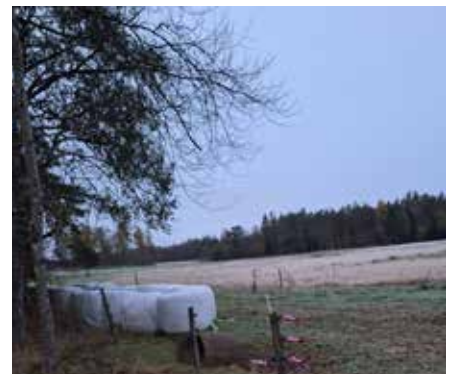
Ängen där vi genomförde Korum vid Mobiliseringsövningen