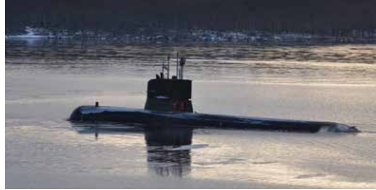
HMS Södermanland.

Det blev lite långdraget för våra plutoner så man drog ut en pluton i