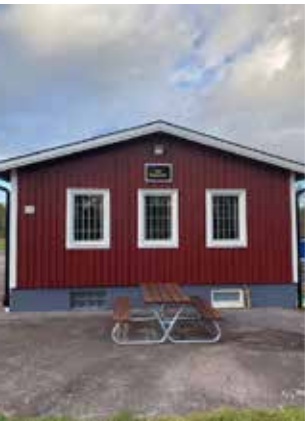
SK16 vörn vid Kranhults bro