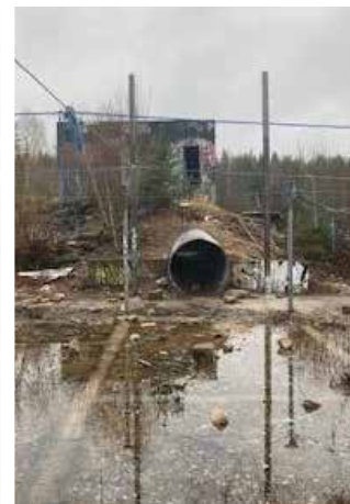
SK16 vörn vid Kranhults bro