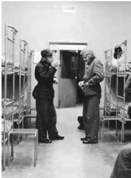
Man fick röka på logementen på den tiden