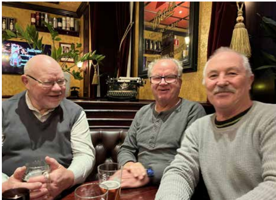
Många skratt.

Vi träffas en gång i månaden under höst vinter och vår. Jag skickar ut ett gruppmejl, till alla i gruppen, ca 20 dagar före kommande träff, presumtiva deltagare behöver inte anmäla sitt deltagande. Jag bokar bord för att säkra plats på The Golden Days som ligger på Södra