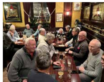
Vänner för livet.