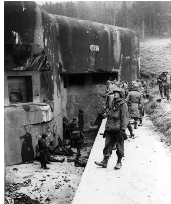
Amerikanska trupper inspekterar Maginot-linjen 1944

Då det är trångt i luften sker en incident och en undanmanöver för att inte krocka. Under den undanmanövern slits bogserlinan av till det glidflygplan där löjtnant Witzig befinner sig och de tvingas nödlända på tysk mark. Ett annat glidflygplan missuppfattar situa-