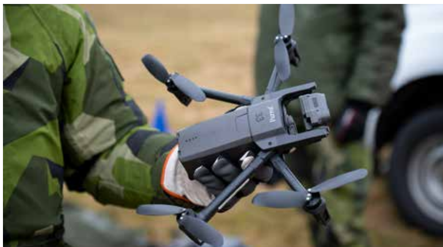
UAV 06 A innehåller en flygfarkost av quadcoptermodell som drivs av fyra rotor, samt en handkontroll med bildskärm för styrning av farkosten.

– Inom hemvärnsförbanden i Sverige är andelen kvinnor 10,2%. Det motsvaras även i EBG förband, med en fördel-