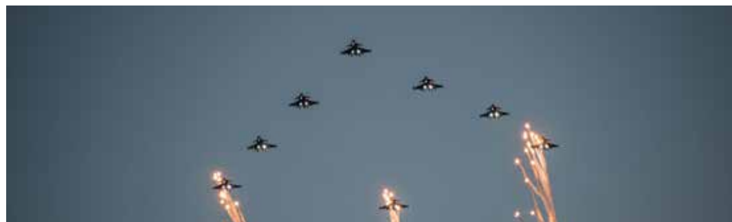
Julgransflygning med JAS 39 Gripen.

Det tänkta upplägget är att tidningen "Älvsborgarna med Älvsborgaren" framgent ges ut