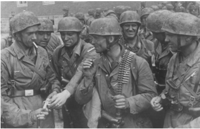
Sturmabteilung Koch efter genomfört uppdrag vid Eben Emael den 12 maj 1944