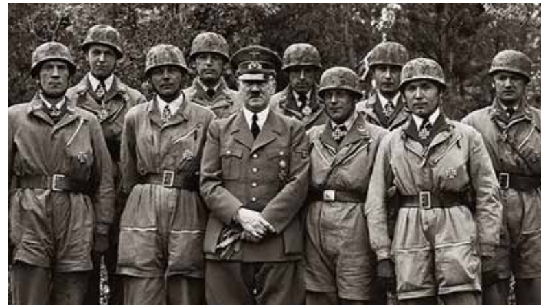
Hitler omgiven av de chefer som dekorerades med riddarkorset för sina insatser vid Eben Emael 1940

särskilt intensiva och förlusterna stora. Under dagen utsätts samtliga brogrupper för motanfall och intensiv artillerield.