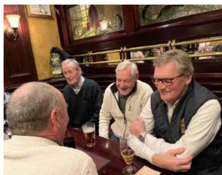
Trevliga samtal.

Hamngatan i Göteborg. Den som kan komma och det brukar betyda ett deltagande på mellan 15-20 personer. Några tar en eller två öl medan några intar fast föda. Mycket snack om det som var förr men även om vad som händer i våra liv nu.